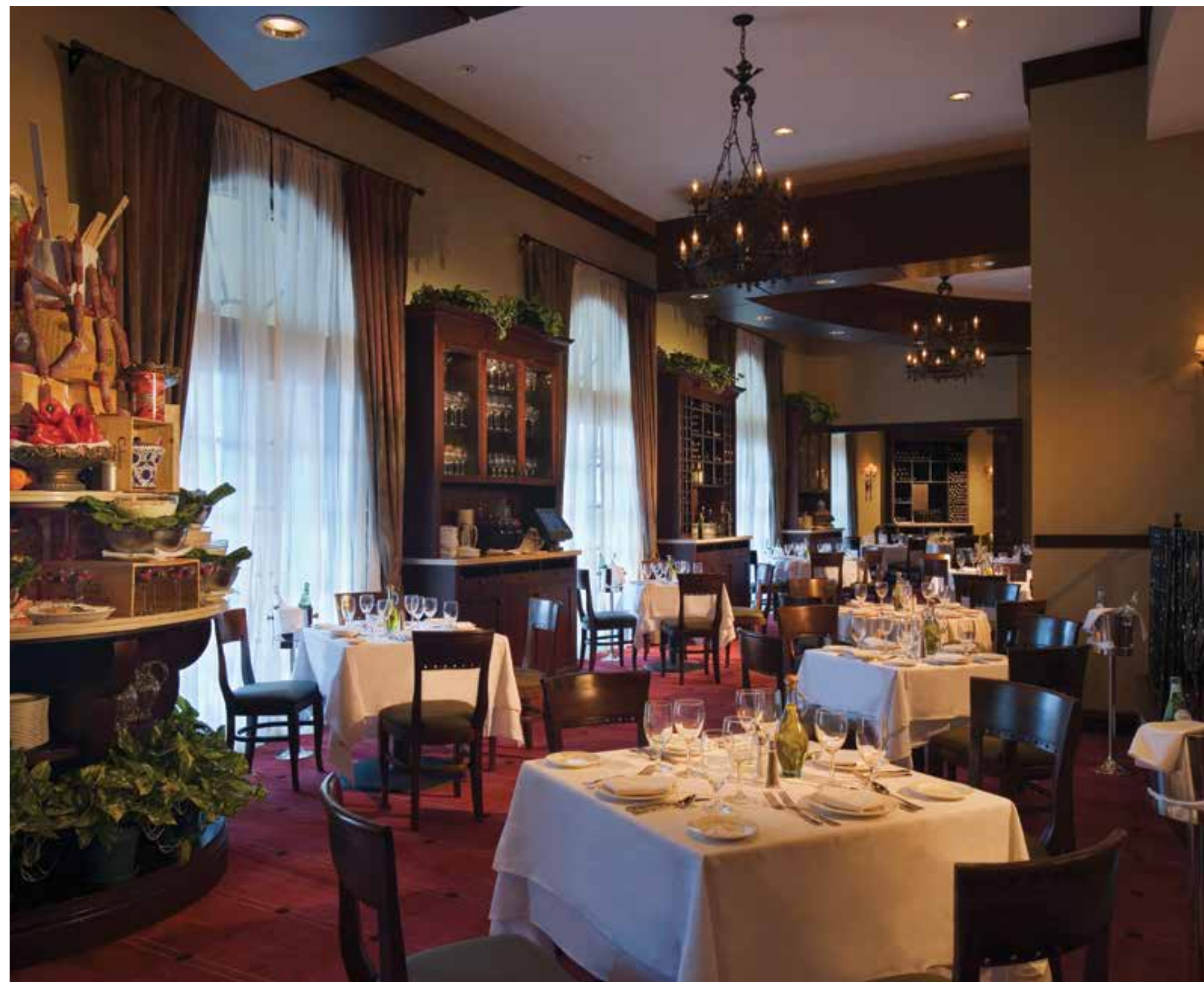
РЕСТОРАН IL MULINO NEW YORK