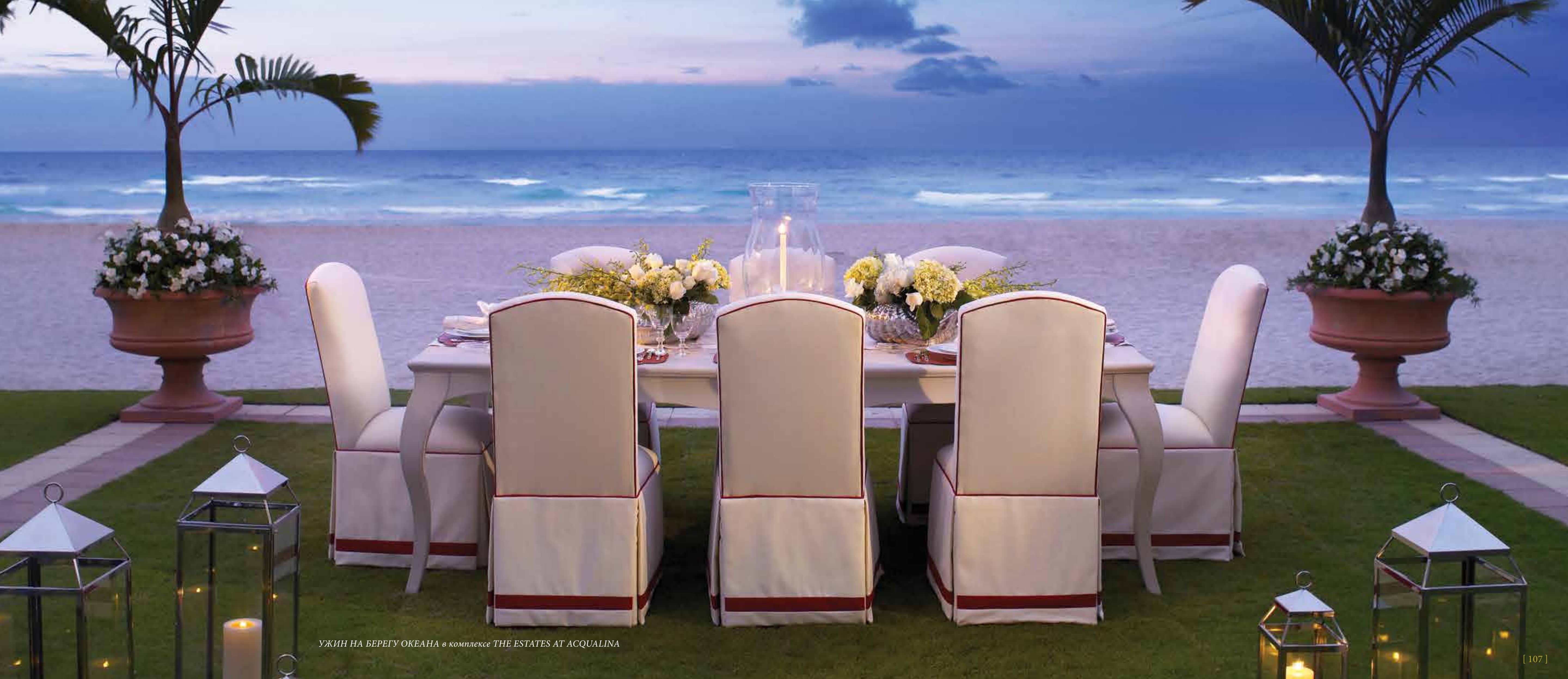
УЖИН НА БЕРЕГУ ОКЕАНА в комплексе THE ESTATES AT ACQUALINA