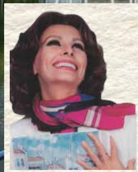
СОФИ ЛОРЕН официальное лицо комплекса WILLIAMS ISLAND