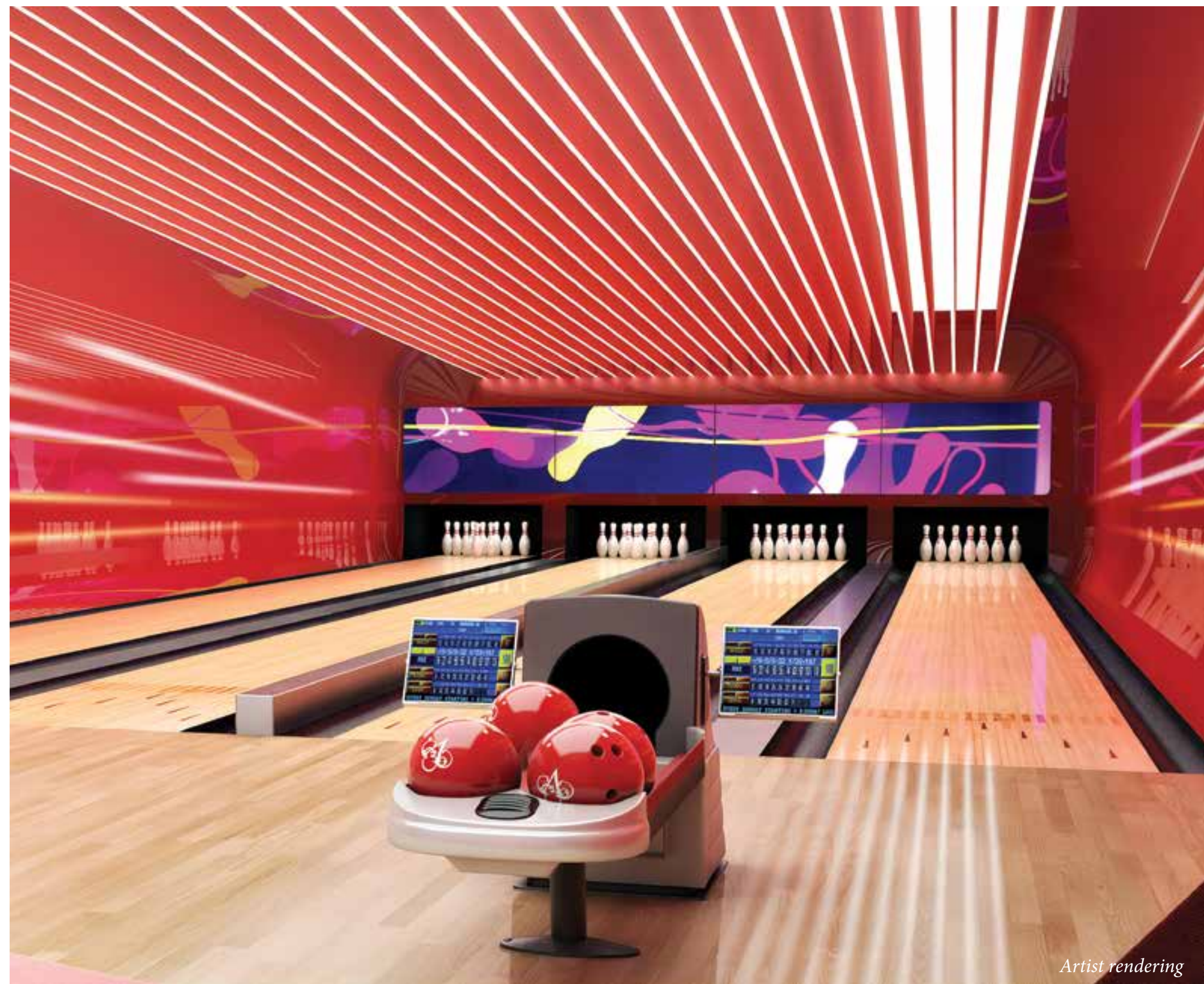
VILLA ACQUALINA — ЗАЛ ДЛЯ БОУЛИНГА НА ЧЕТЫРЕ ДОРОЖКИ