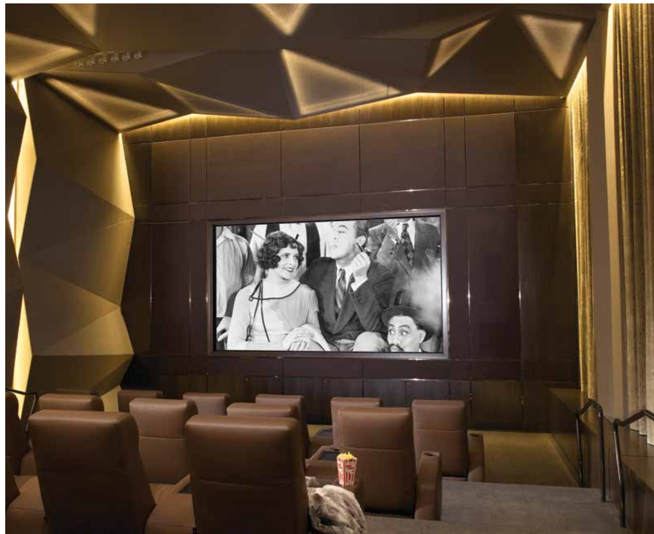
КИНОТЕАТР НА ТЕРРИТОРИИ КОМПЛЕКСА