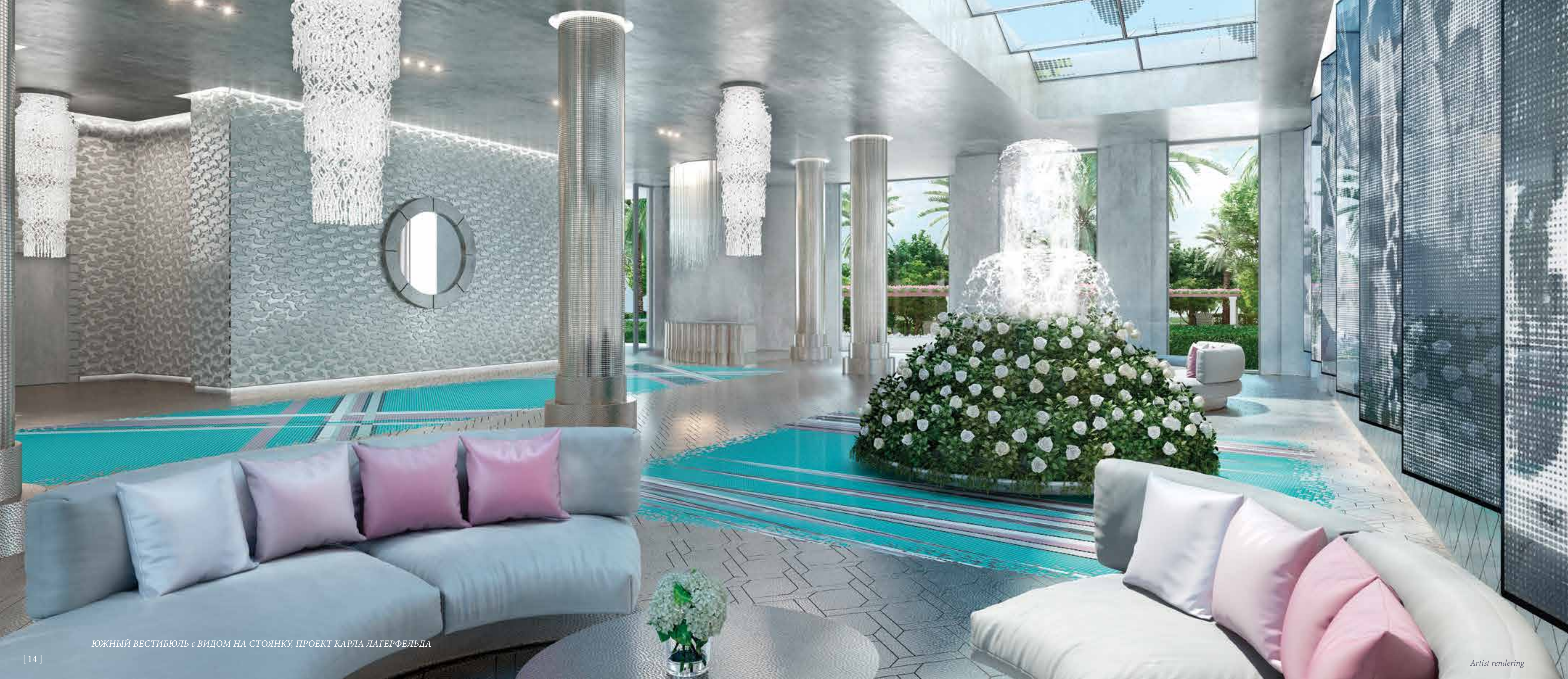
ЮЖНЫЙ ВЕСТИБУЛЬ с ВИДОМ НА СТОЯНКУ, ПРОЕКТ КАРЛА ЛАГЕРФЕЛЬДА