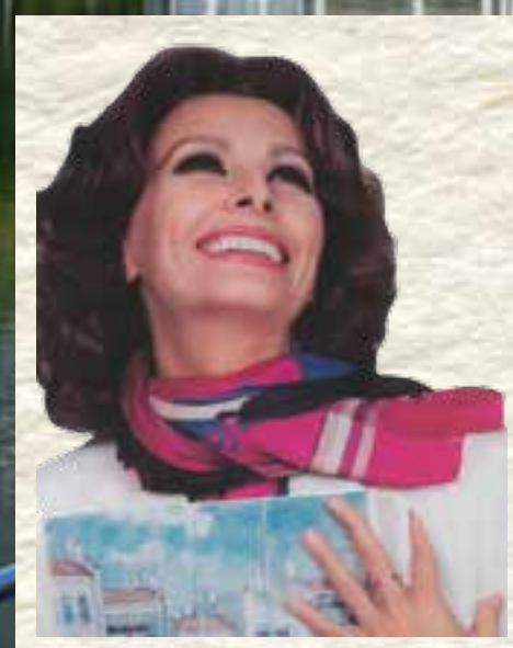
SOPHIA LOREN, porta-voz da WILLIAMS ISLAND