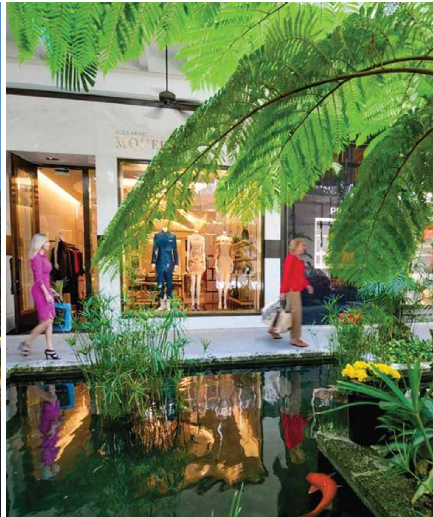
BAL HARBOUR Shops