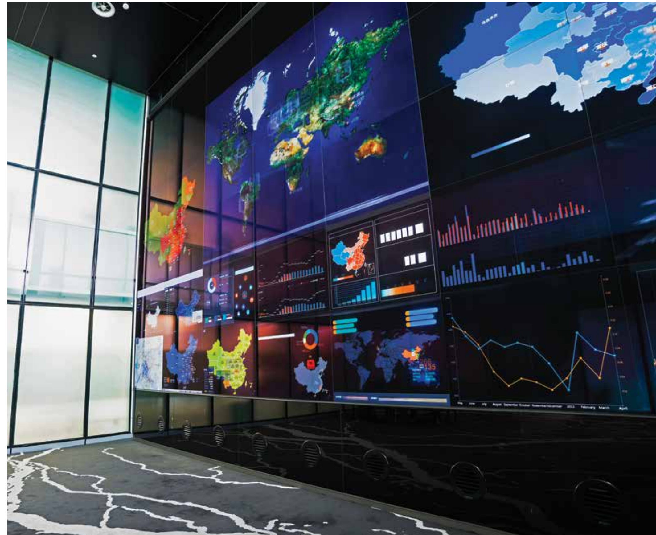
SALA PARA INVESTIDORES (WALL STREET TRADING ROOM), onde você poderá comprar, vender e realizar transações junto à Bolsa de Valores