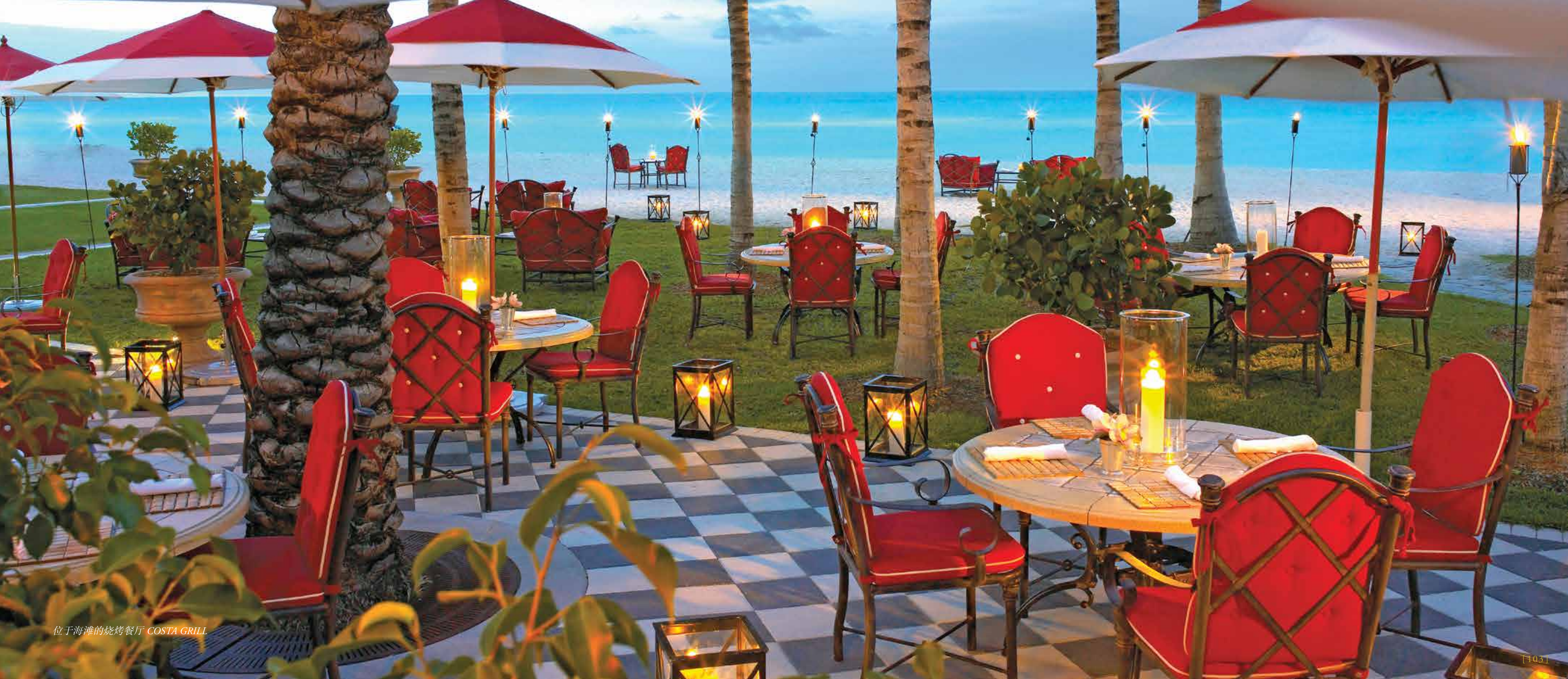
位于海滩的烧烤餐厅 COSTA GRILL