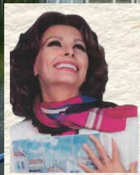
SOPHIA LOREN, WILLIAMS ISLAND 代言人

The Estates at Acqualina 的开发商和拥有者是 Eddie and Jules Trump 的附属公司，从 1985 年成功打造 Williams Island 开始，至今已经发展了一系列高级奢华房地产项目。Williams Island 是八栋高耸塔楼组成的社区，体现了我们打造现代地中海风格庄园的愿景，其内有度假村和俱乐部设施，是南佛罗里达首个同类开发项目。之后，公司开发的项目不断增加，包括位于佛罗里达州博卡拉顿的 Luxuria Residences，还有佛罗里达阳光岛大西洋海滩的 Acqualina Resort & Spa、The Mansions at Acqualina 以及 The Estates at Acqualina。此外，公司还在加利福尼亚持有大量土地和开发项目。