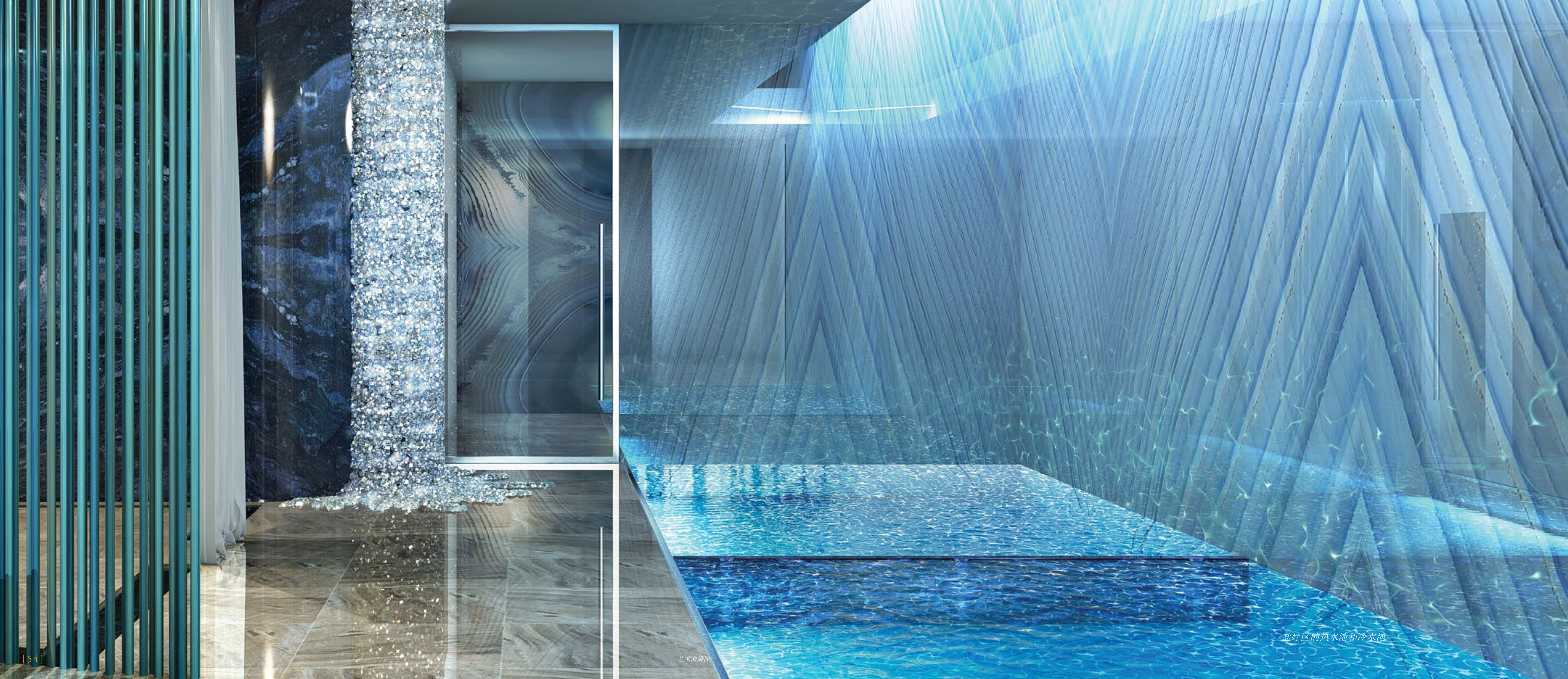
盐疗区的热水池和冷水池