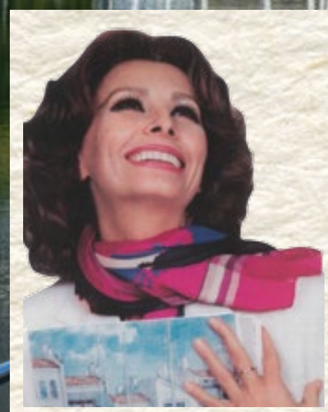
SOPHIA LOREN, WILLIAMS ISLAND 代言人

The Estates at Acqualina 的开发商和拥有者是 Eddie and Jules Trump 的附属公司，从 1985 年成功打造 Williams Island 开始，至今已经发展了一系列高级奢华房地产项目。Williams Island 是八栋高耸塔楼组成的社区，体现了我们打造现代地中海风格庄园的愿景，其内有度假村和俱乐部设施，是南佛罗里达首个同类开发项目。之后，公司开发的项目不断增加，包括位于佛罗里达州博卡拉顿的 Luxuria Residences，还有佛罗里达阳光岛大西洋海滩的 Acqualina Resort & Spa、The Mansions at Acqualina 以及 The Estates at Acqualina。此外，公司还在加利福尼亚持有大量土地和开发项目。