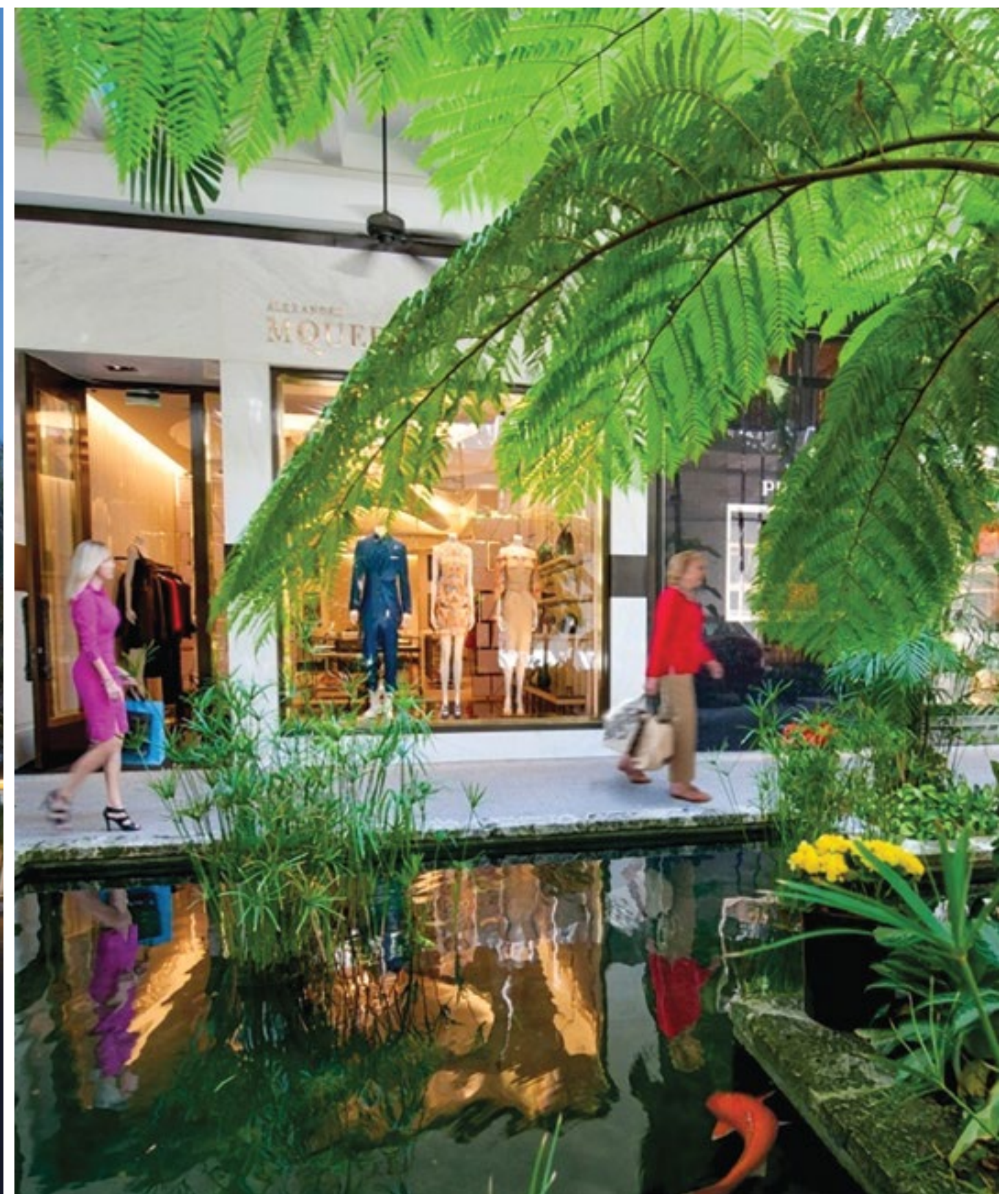
阿文图拉购物广场