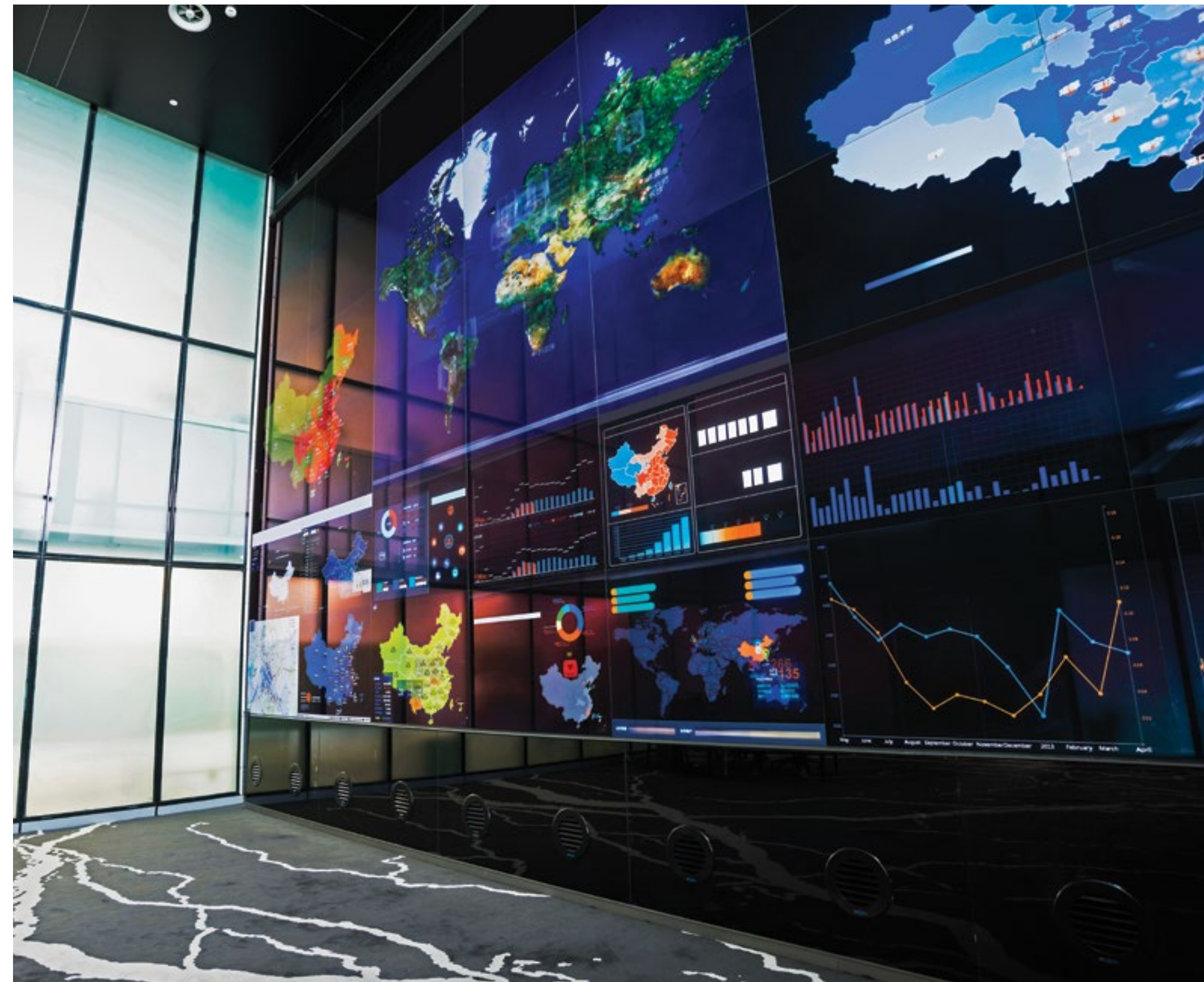
SALA PARA INVESTIDORES (WALL STREET TRADING ROOM), onde você poderá comprar, vender e realizar transações junto à Bolsa de Valores