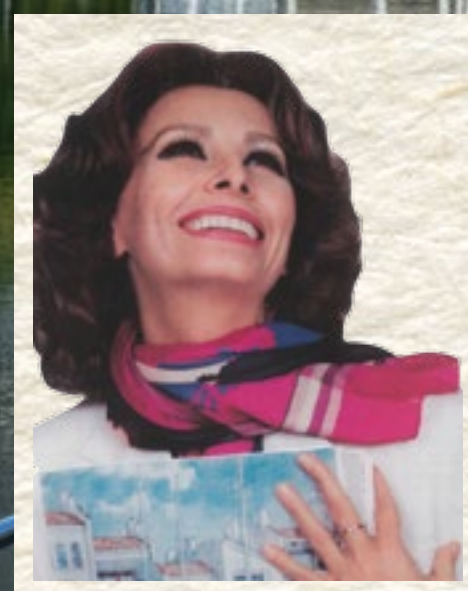
SOPHIA LOREN, porta-voz da WILLIAMS ISLAND