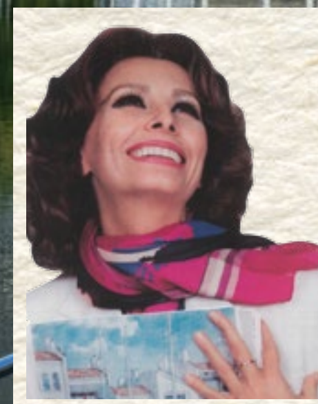
СОФИ ЛОРЕН официальное лицо комплекса WILLIAMS ISLAND