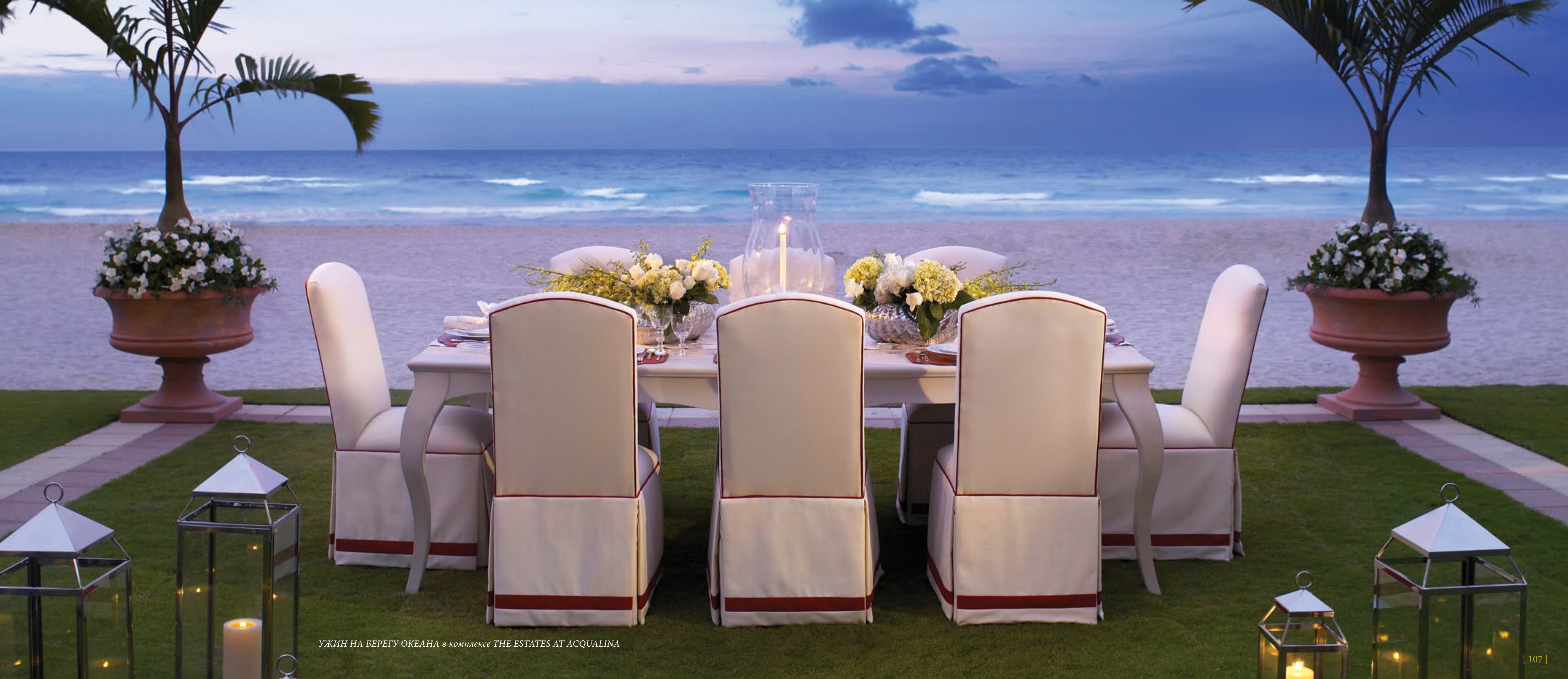
УЖИН НА БЕРЕГУ ОКЕАНА в комплексе THE ESTATES AT ACQUALINA