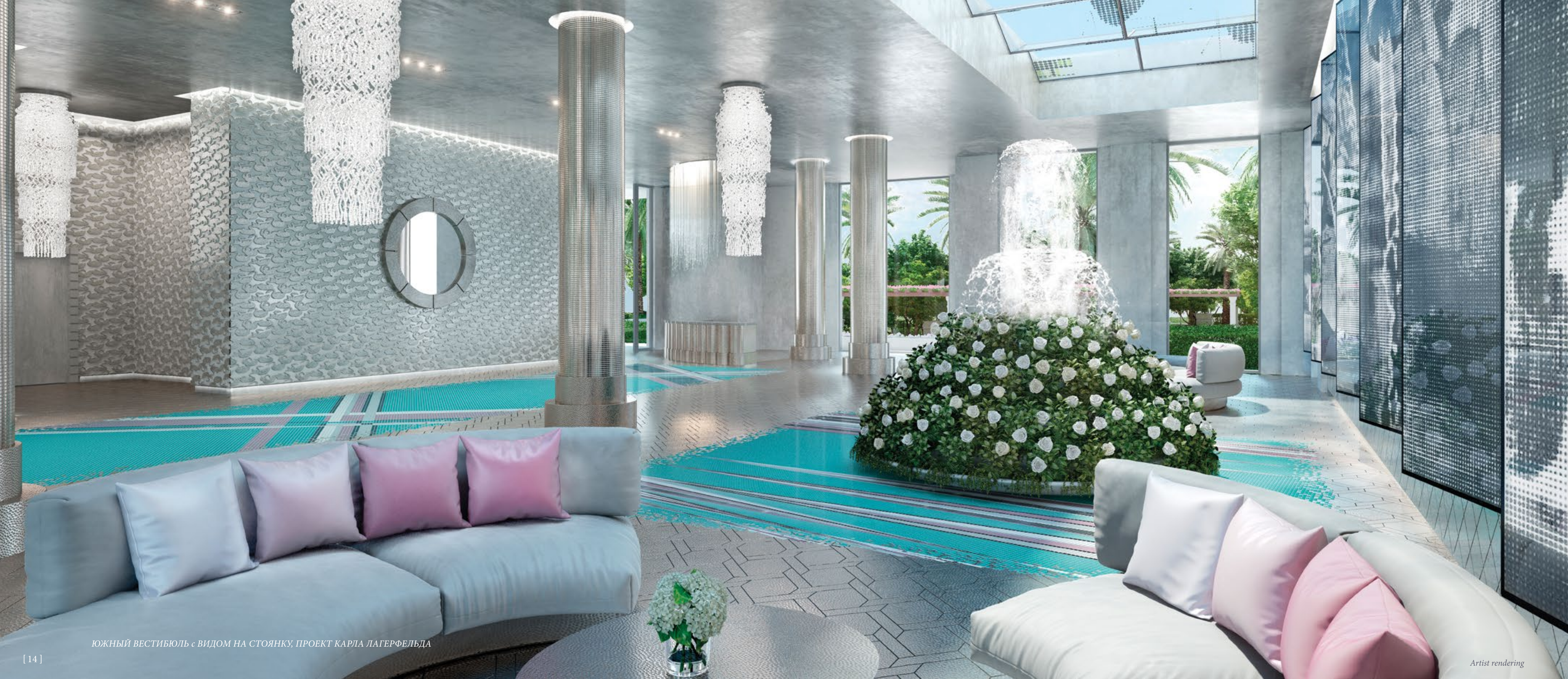
ЮЖНЫЙ ВЕСТИБУЛЬ с ВИДОМ НА СТОЯНКУ, ПРОЕКТ КАРЛА ЛАГЕРФЕЛЬДА