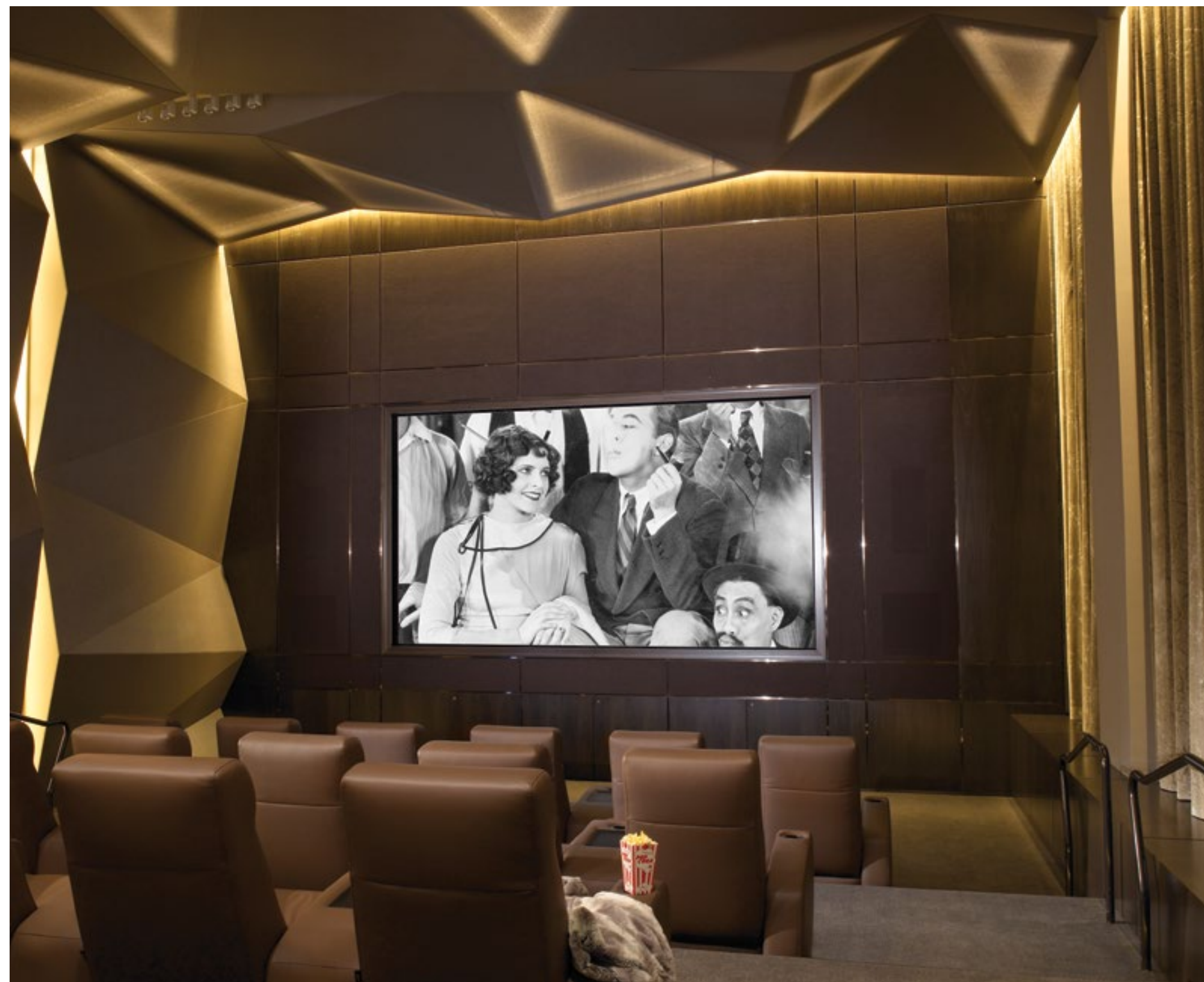
КИНОТЕАТР НА ТЕРРИТОРИИ КОМПЛЕКСА