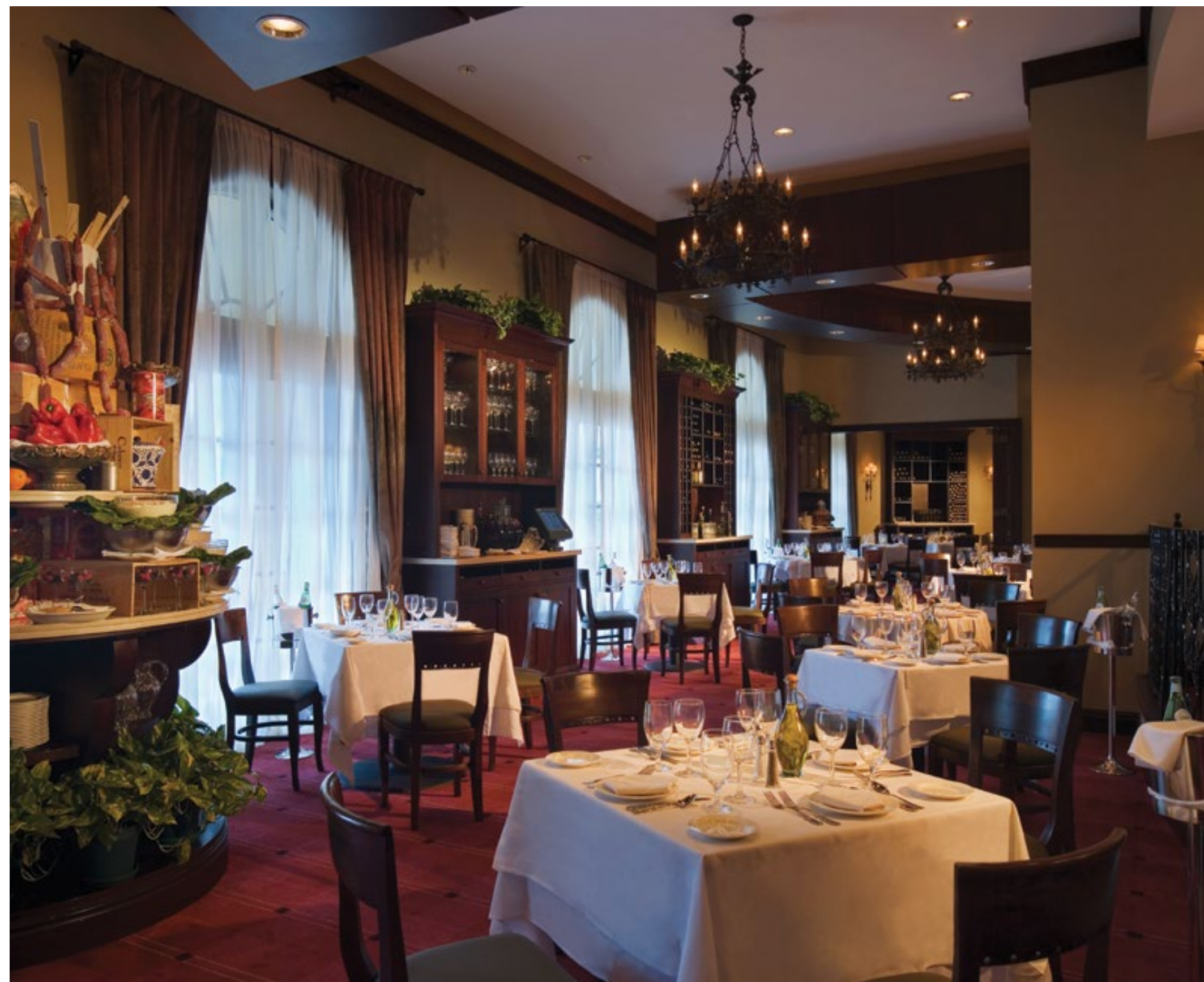
РЕСТОРАН IL MULINO NEW YORK