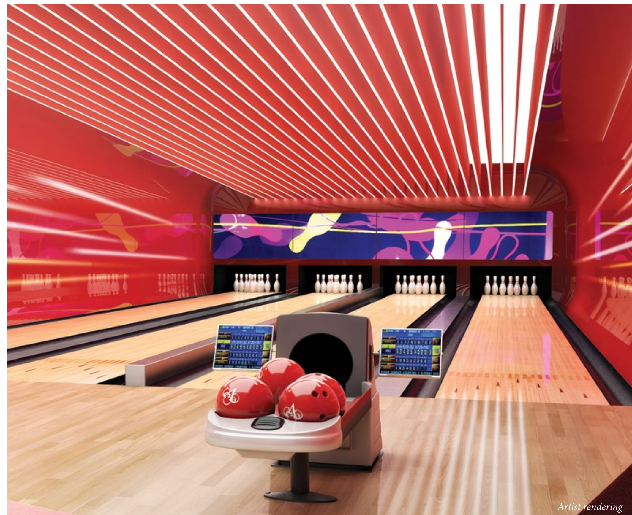
VILLA ACQUALINA — ЗАЛ ДЛЯ БОУЛИНГА НА ЧЕТЫРЕ ДОРОЖКИ