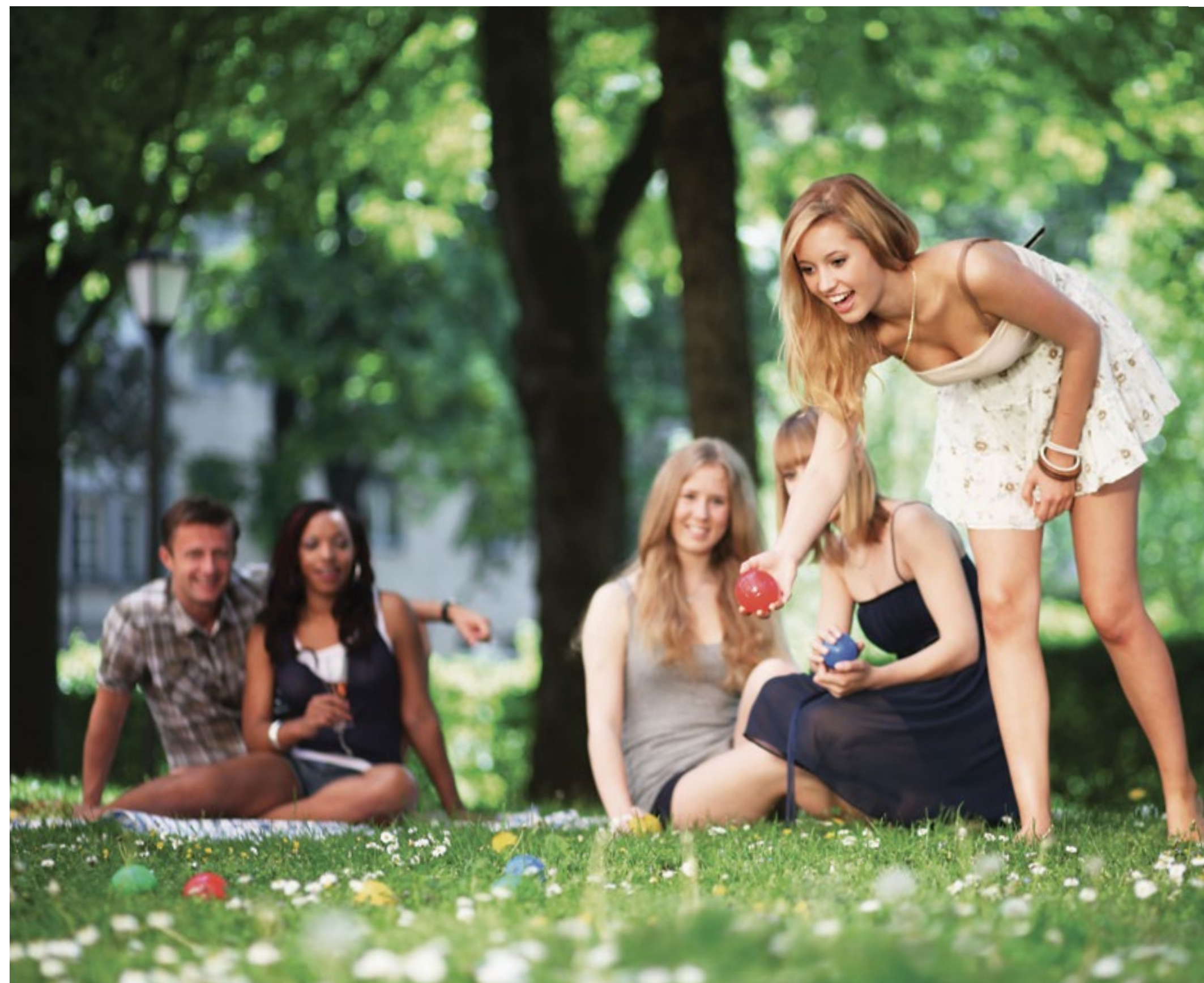
ПЛОЩАДКА ДЛЯ ИГРЫ В БОЧЧЕ