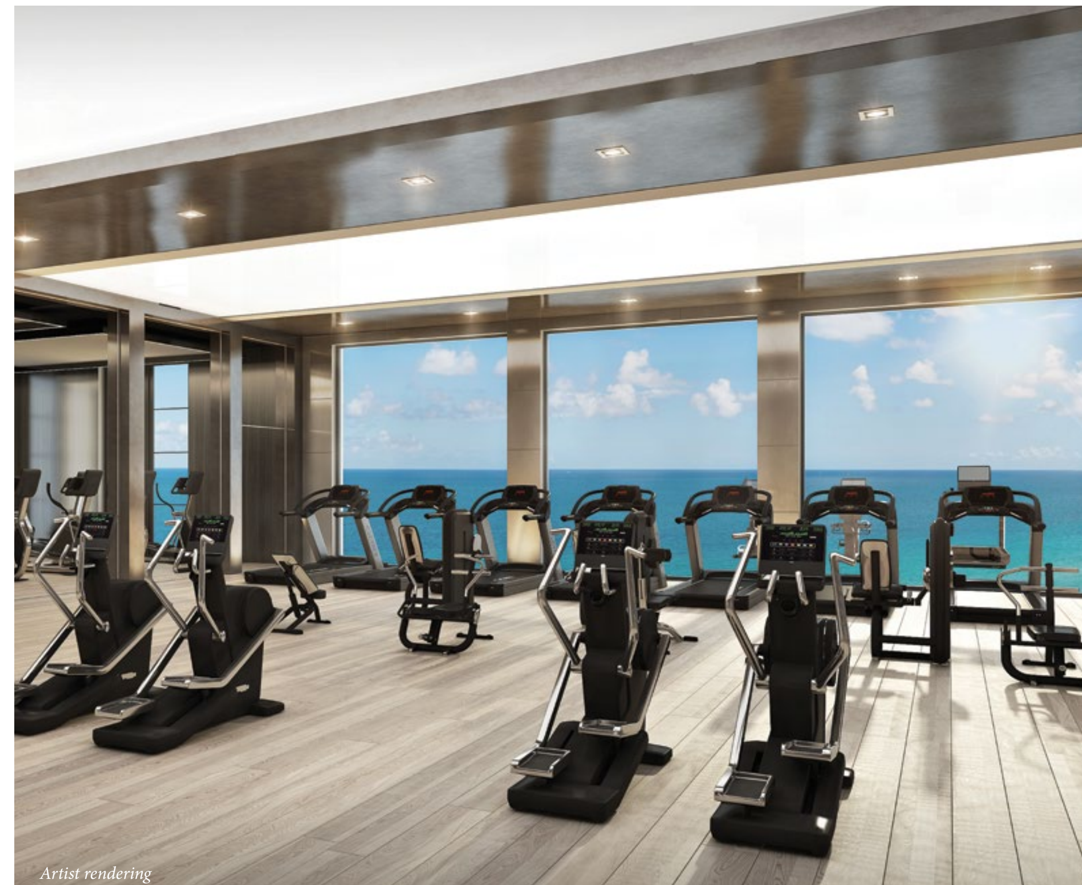
ФИТНЕС-ЦЕНТР с видом на ПЛЯЖ и ОКЕАН