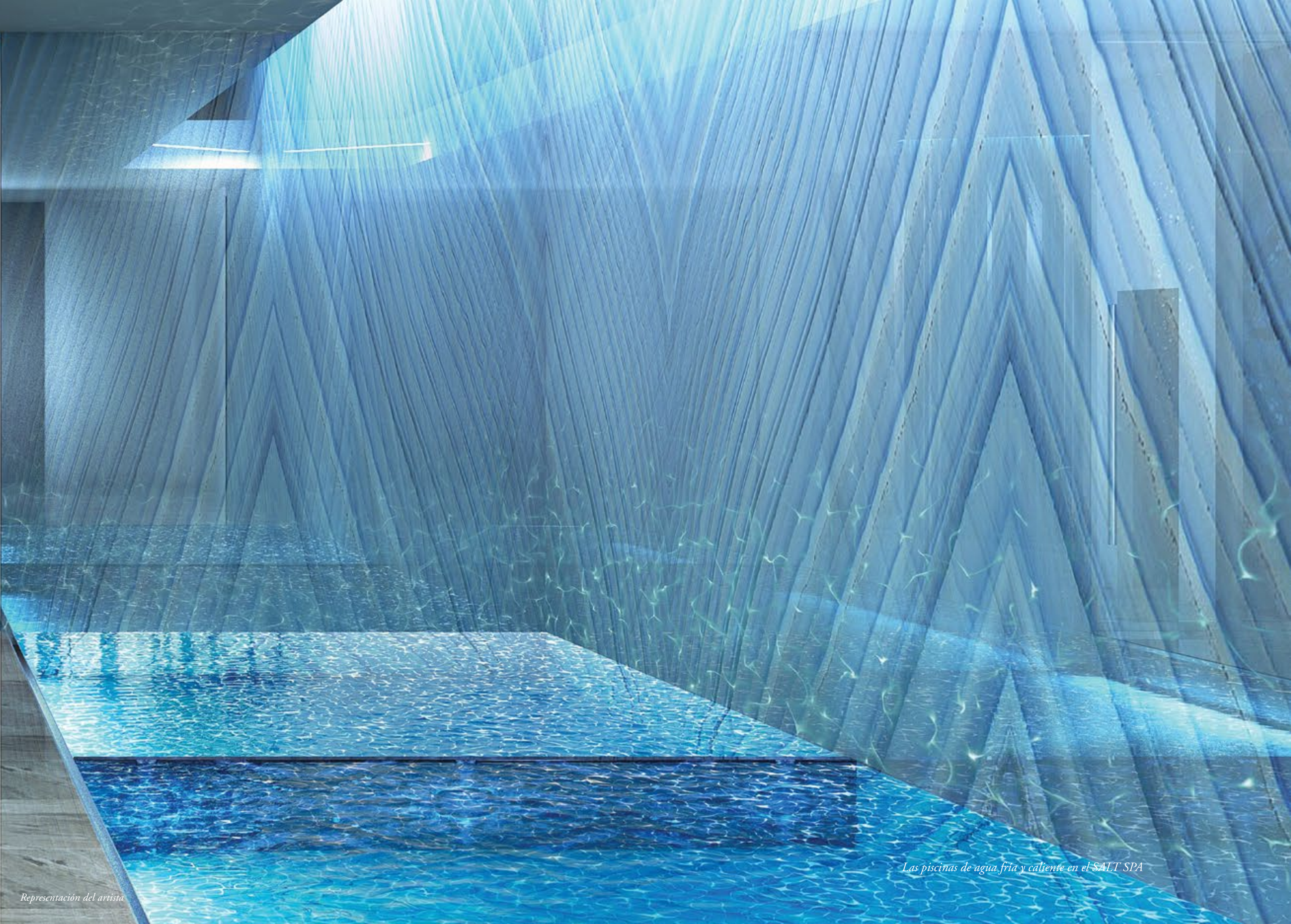
Las piscinas de agua fría y caliente en el SALT SPA