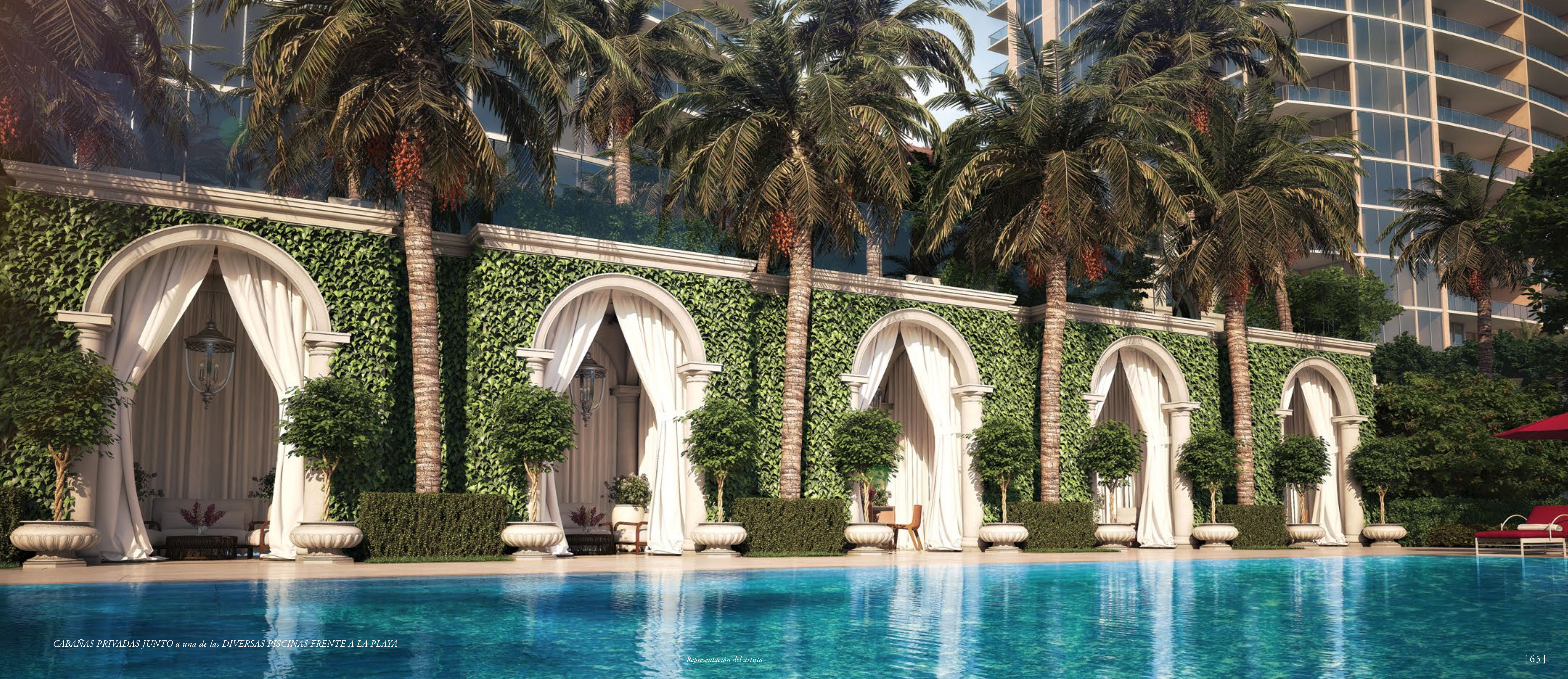
CABAÑAS PRIVADAS JUNTO a una de las DIVERSAS PISCINAS FRENTE A LA PLAYA