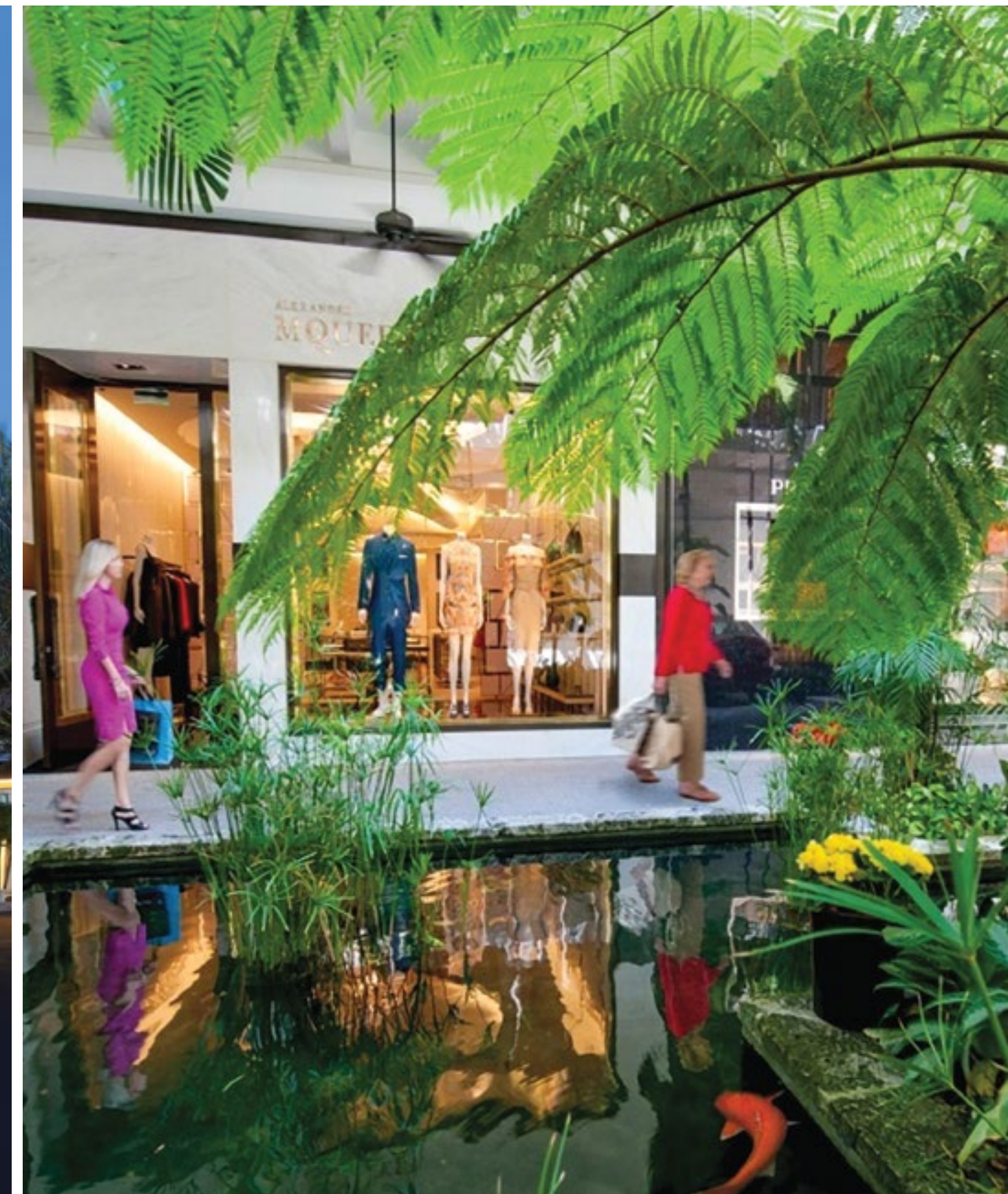
BAL HARBOUR Shops