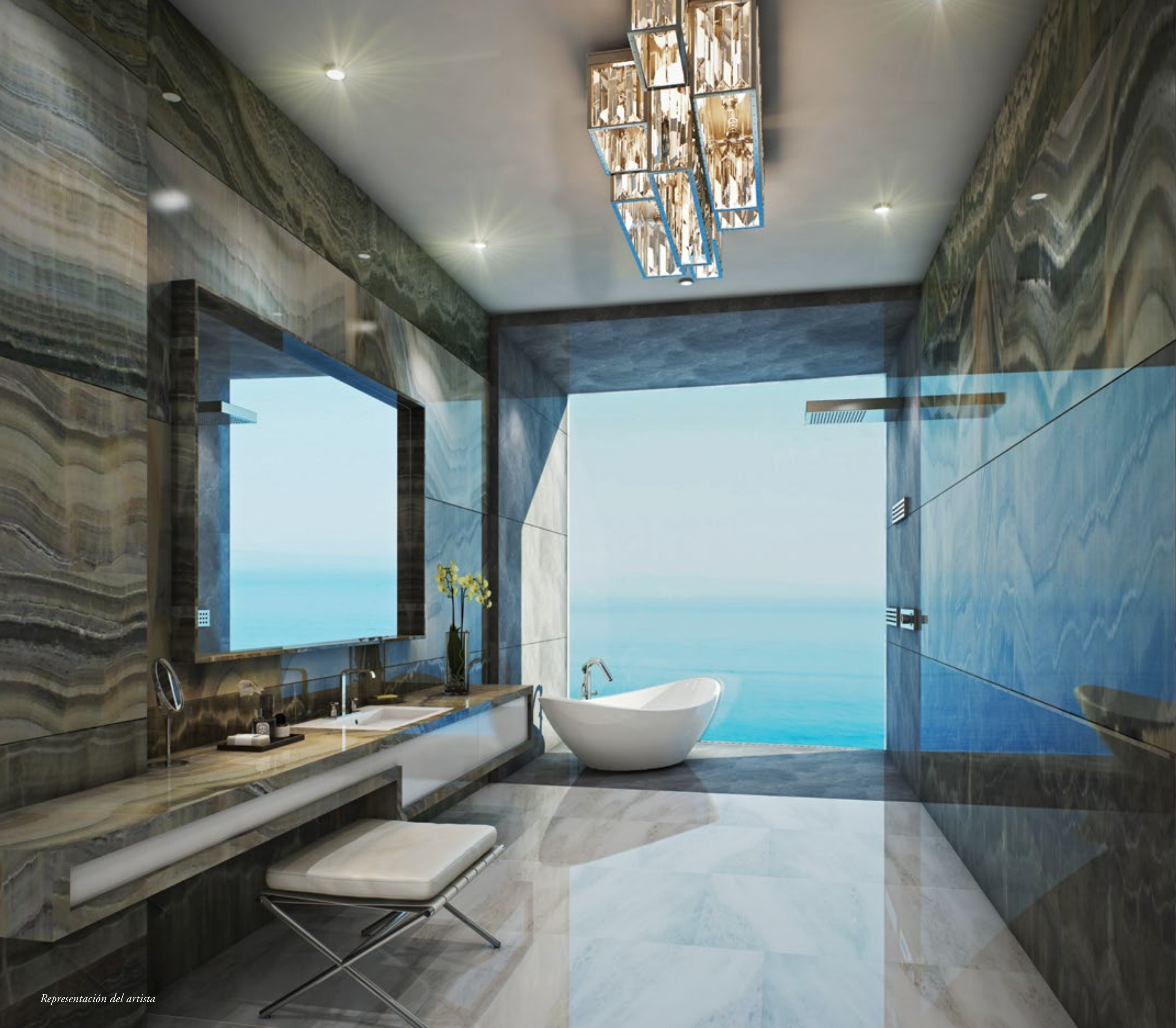
Representación del artista