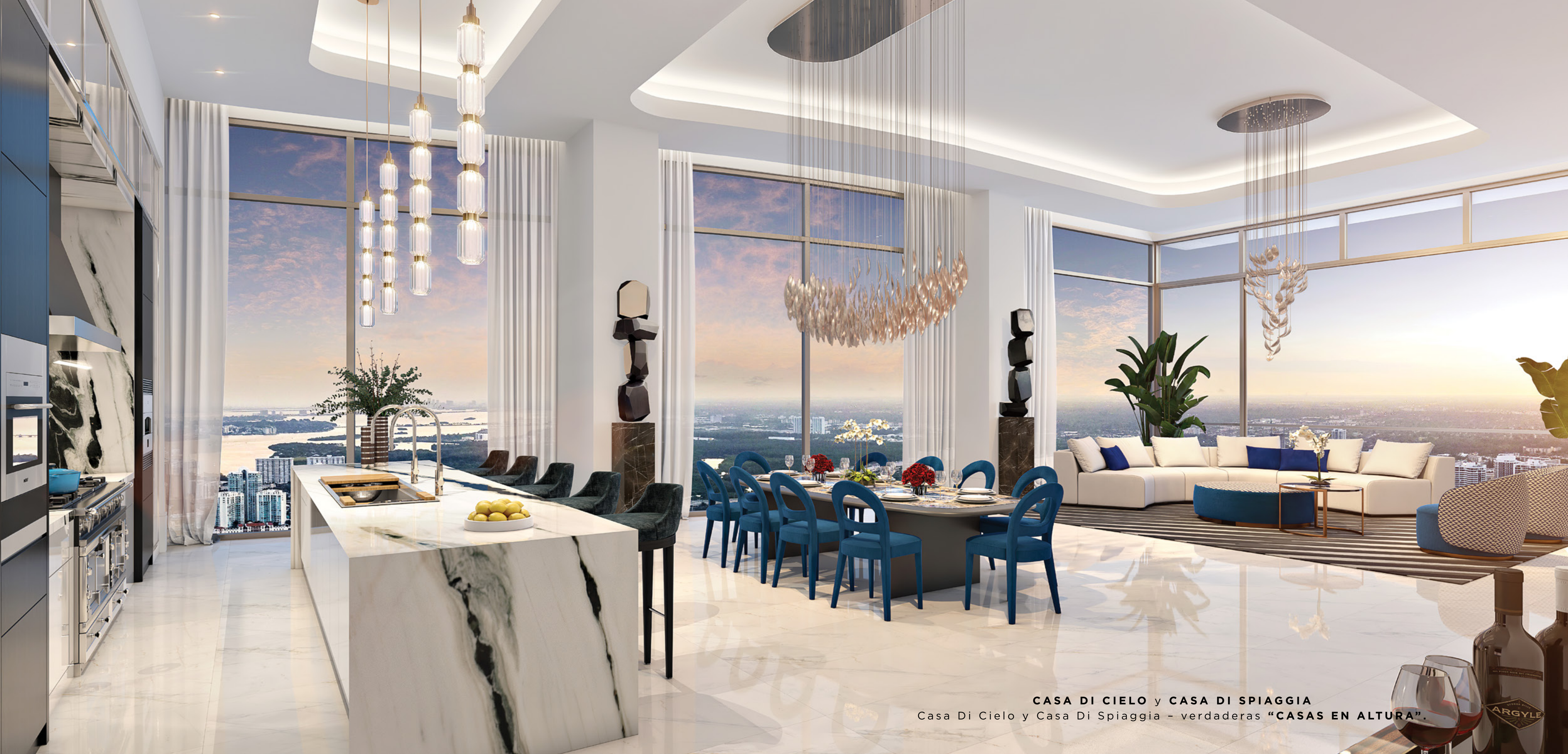
CASA DI CIELO y CASA DI SPIAGGIA Casa Di Cielo y Casa Di Spiaggia - verdaderas "CASAS EN ALTURA".