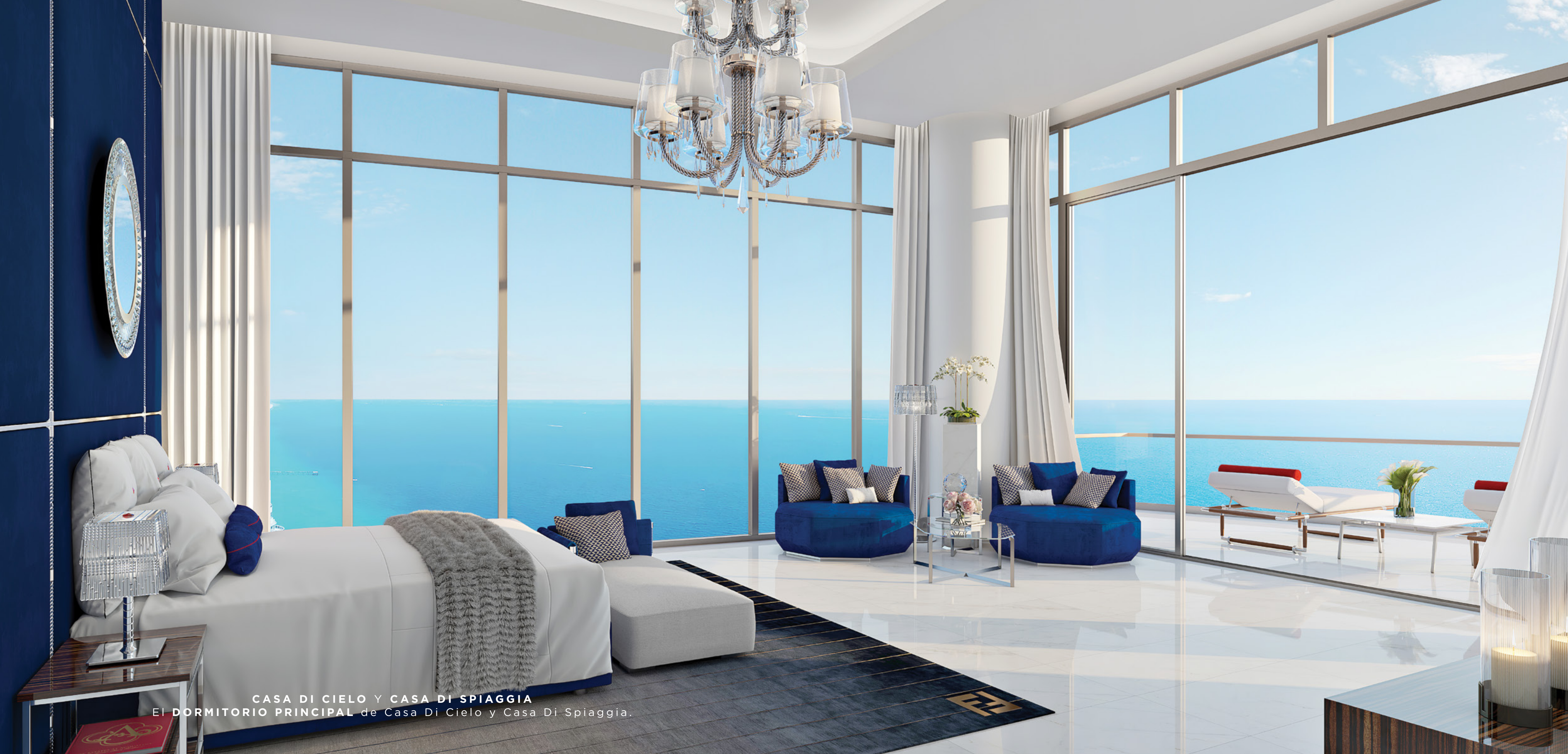
CASA DI CIELO Y CASA DI SPIAGGIA El DORMITORIO PRINCIPAL de Casa Di Cielo y Casa Di Spiaggia.