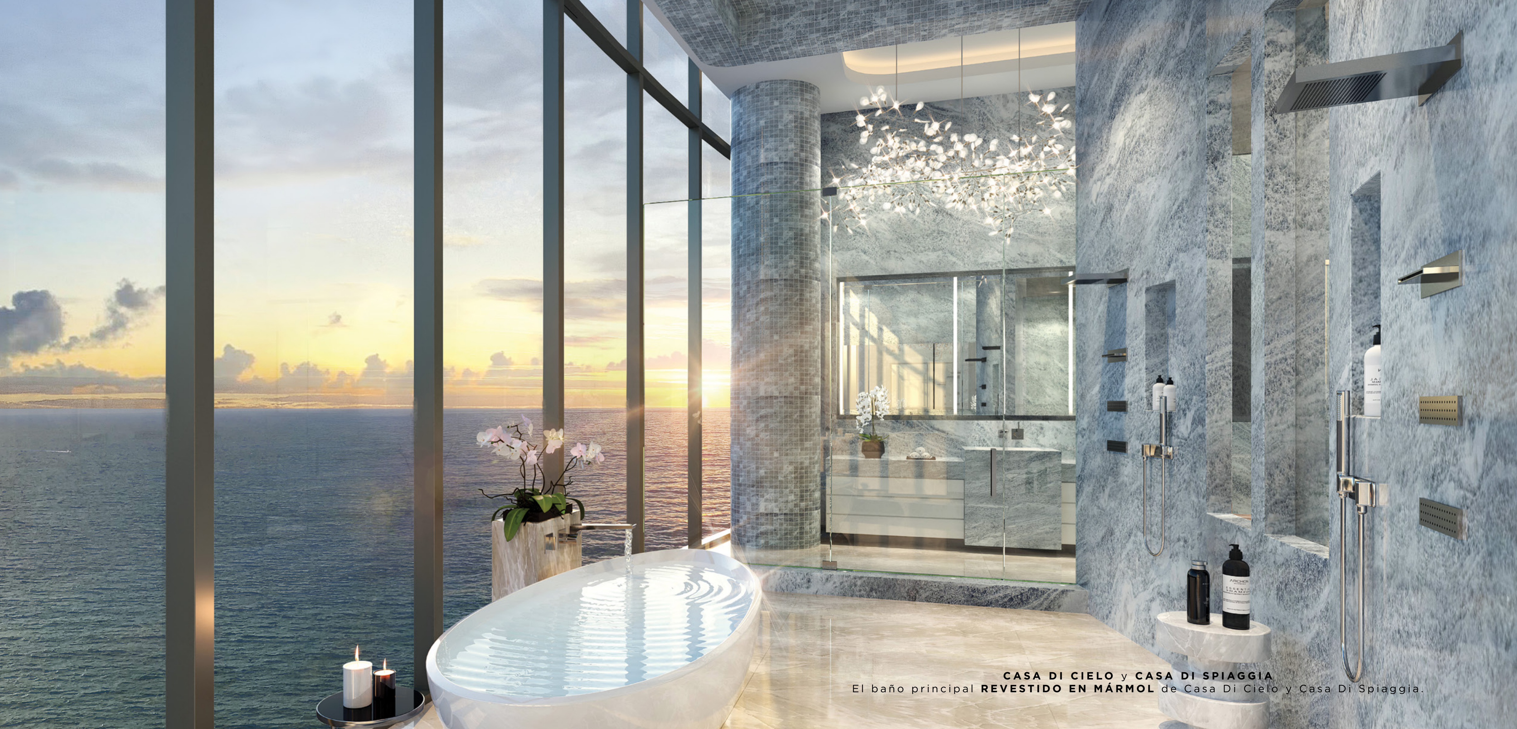
CASA DI CIELO y CASA DI SPIAGGIA El baño principal REVESTIDO EN MÁRMOL de Casa Di Cielo y Casa Di Spiaggia.