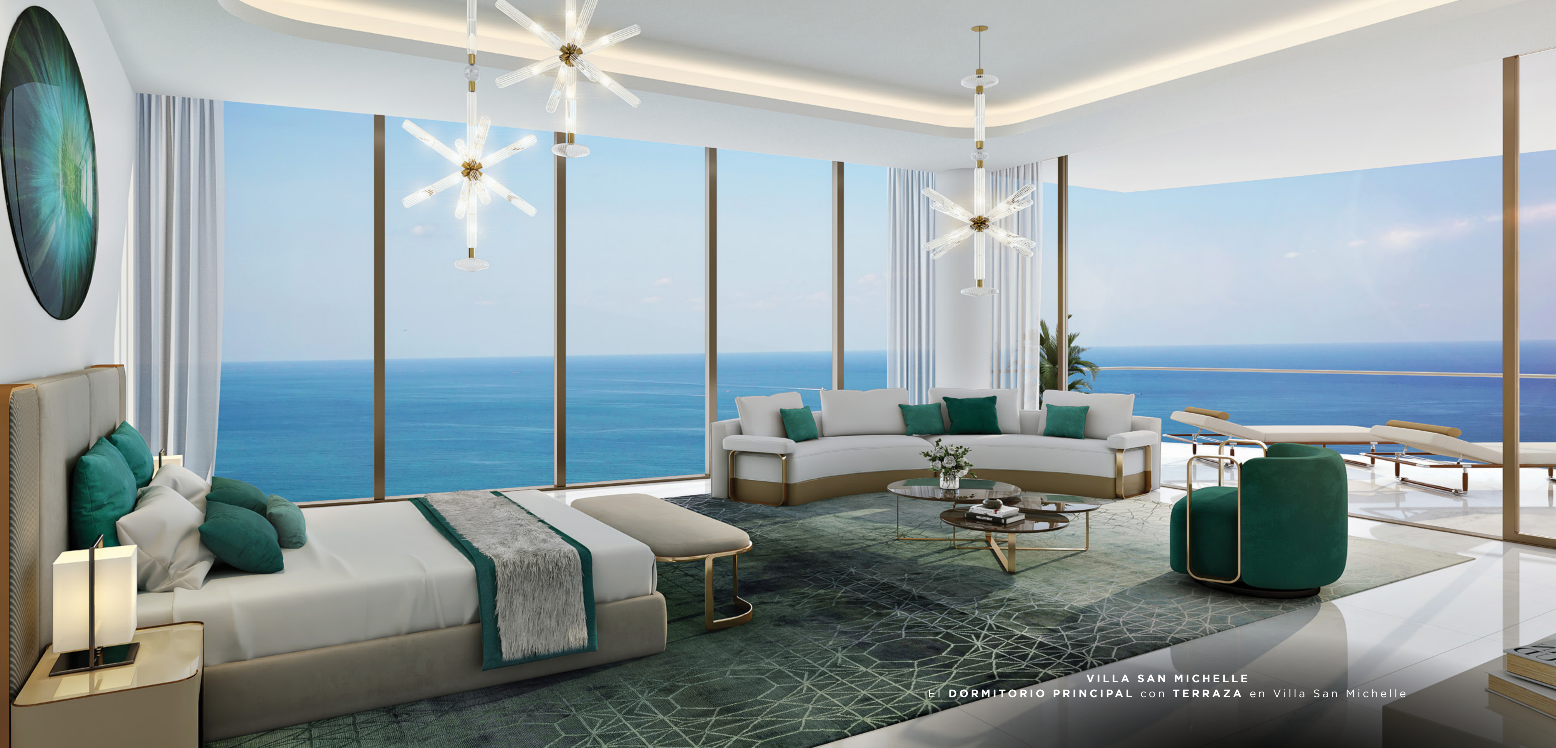
VILLA SAN MICHELLE El DORMITORIO PRINCIPAL con TERRAZA en Villa San Michelle