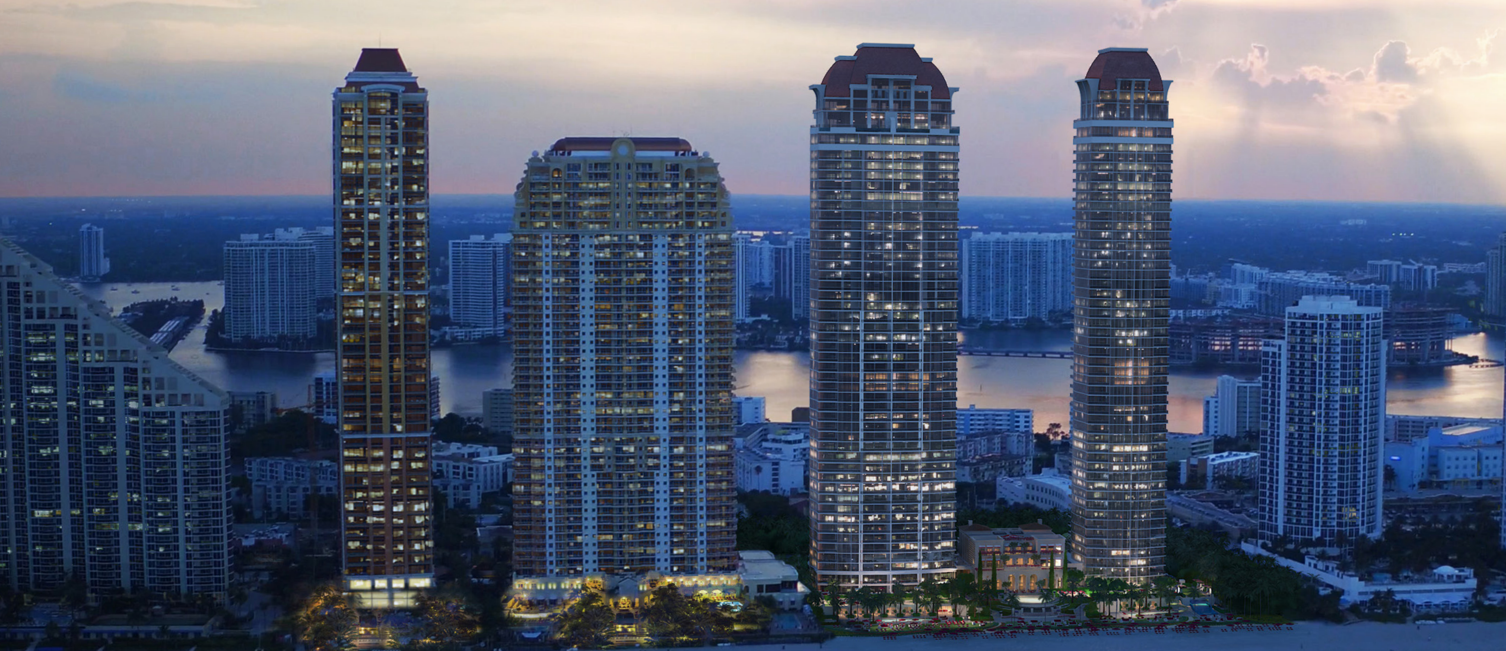
Izquierda a derecha: THE MANSIONS at ACQUALINA, ACQUALINA RESORT, THE ESTATES at ACQUALINA SOUTH TOWER y THE ESTATES AT ACQUALINA BOUTIQUE TOWER.