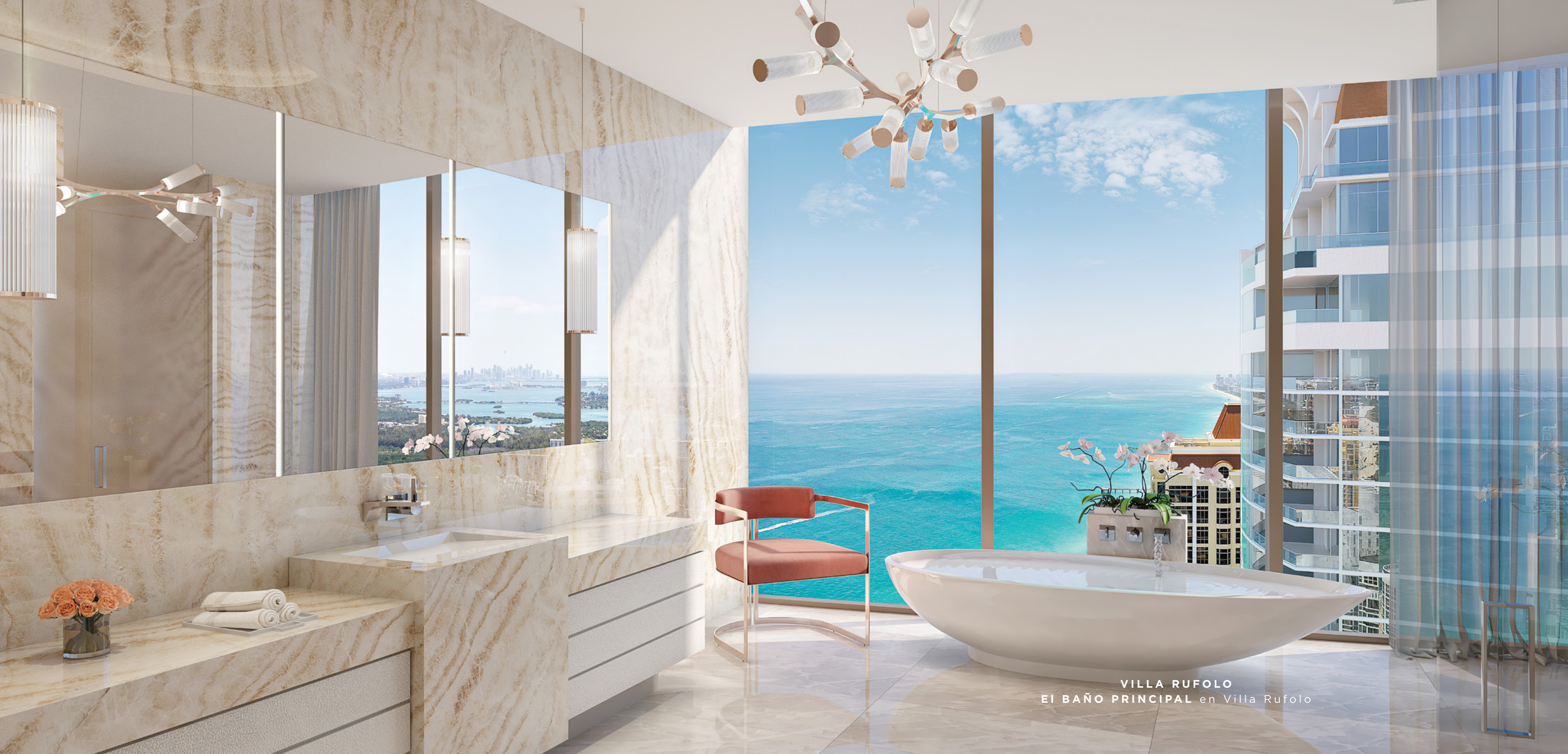
VILLA RUFOLLO EI BAÑO PRINCIPAL en Villa Rufolo