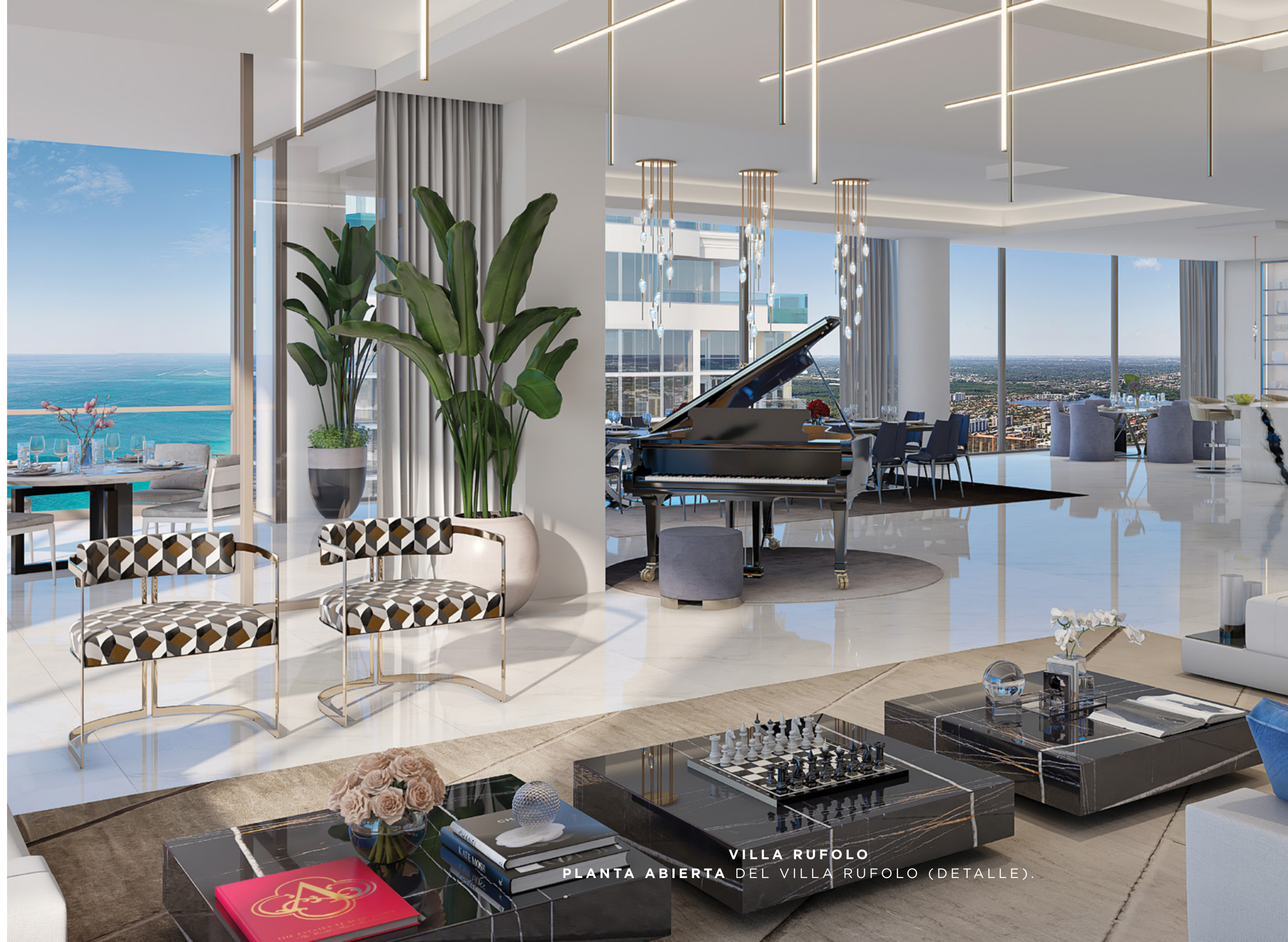
VILLA RUFOLO PLANTA ABIERTA DEL VILLA RUFOLO (DETALLE).

Un piso completo con seis habitaciones, siete baños, dos tocadores, sala amplia, sala familiar, sala de recreación, gimnasio, cuarto de servicio, oficina opcional y sala de aprendizaje, chimenea, ascensores privados y una terraza con sauna, spa y cocina de verano.