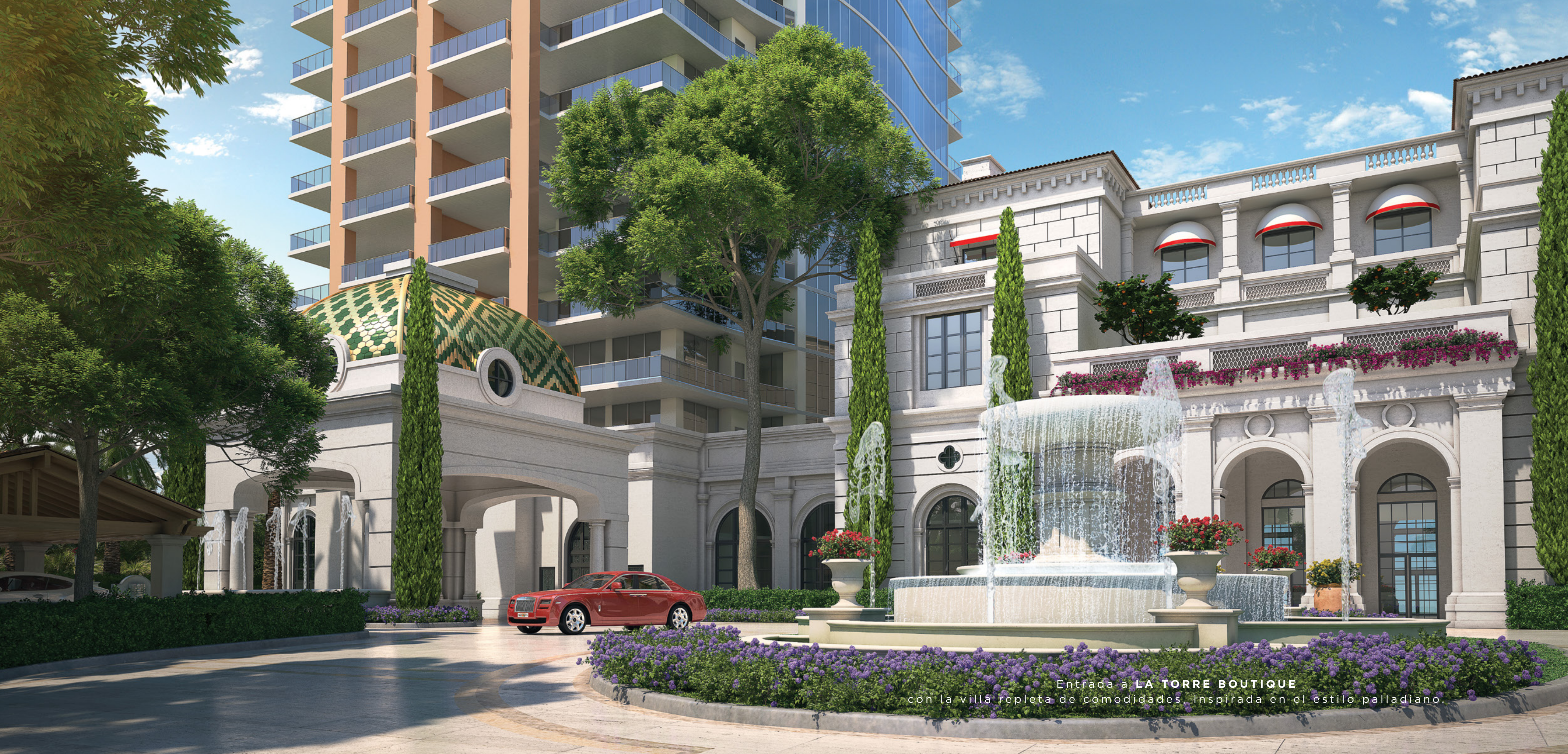
Entrada a LA TORRE BOUTIQUE con la villa repleta de comodidades, inspirada en el estilo palladiano.