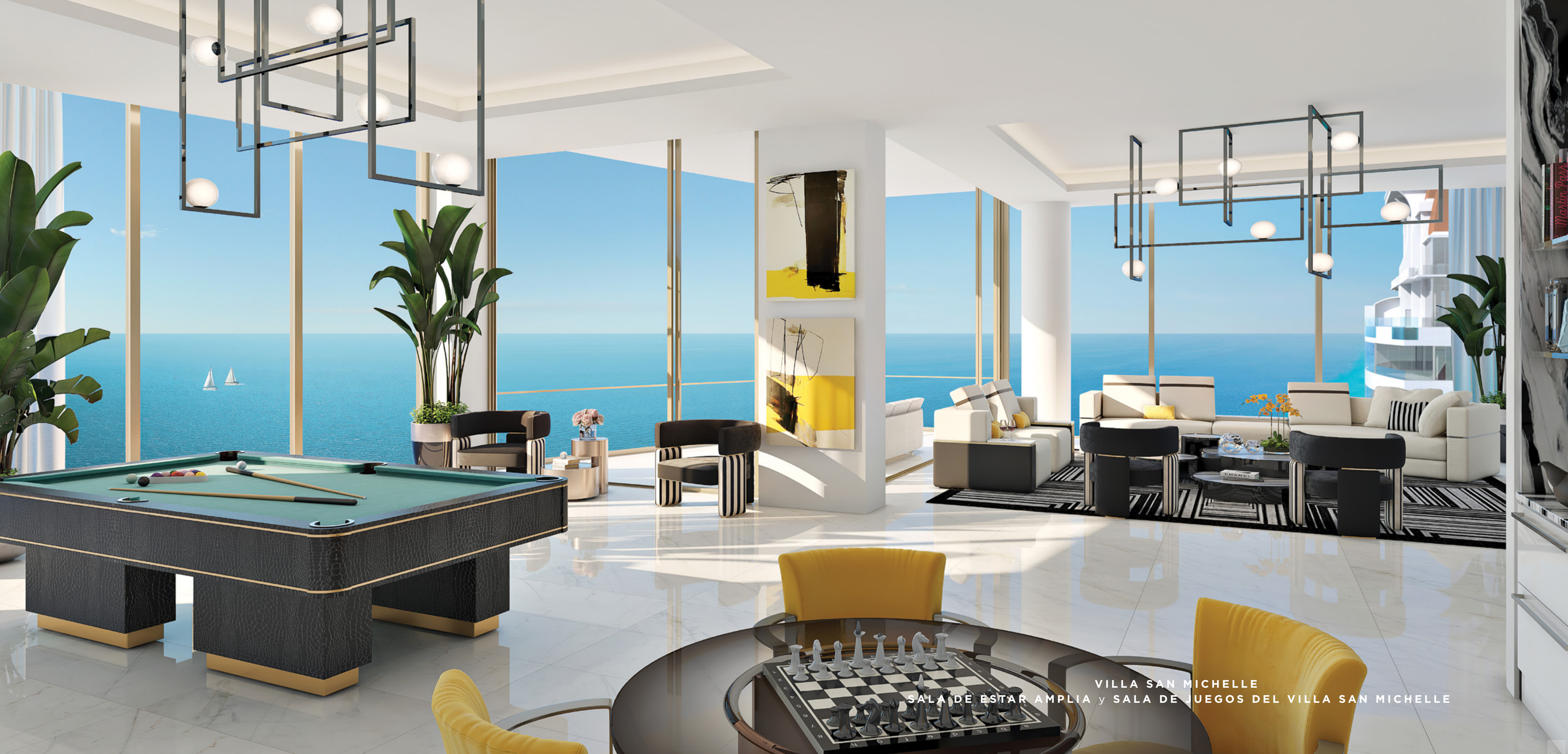
VILLA SAN MICHELLE SALA DE ESTAR AMPLIA y SALA DE JUEGOS DEL VILLA SAN MICHELLE