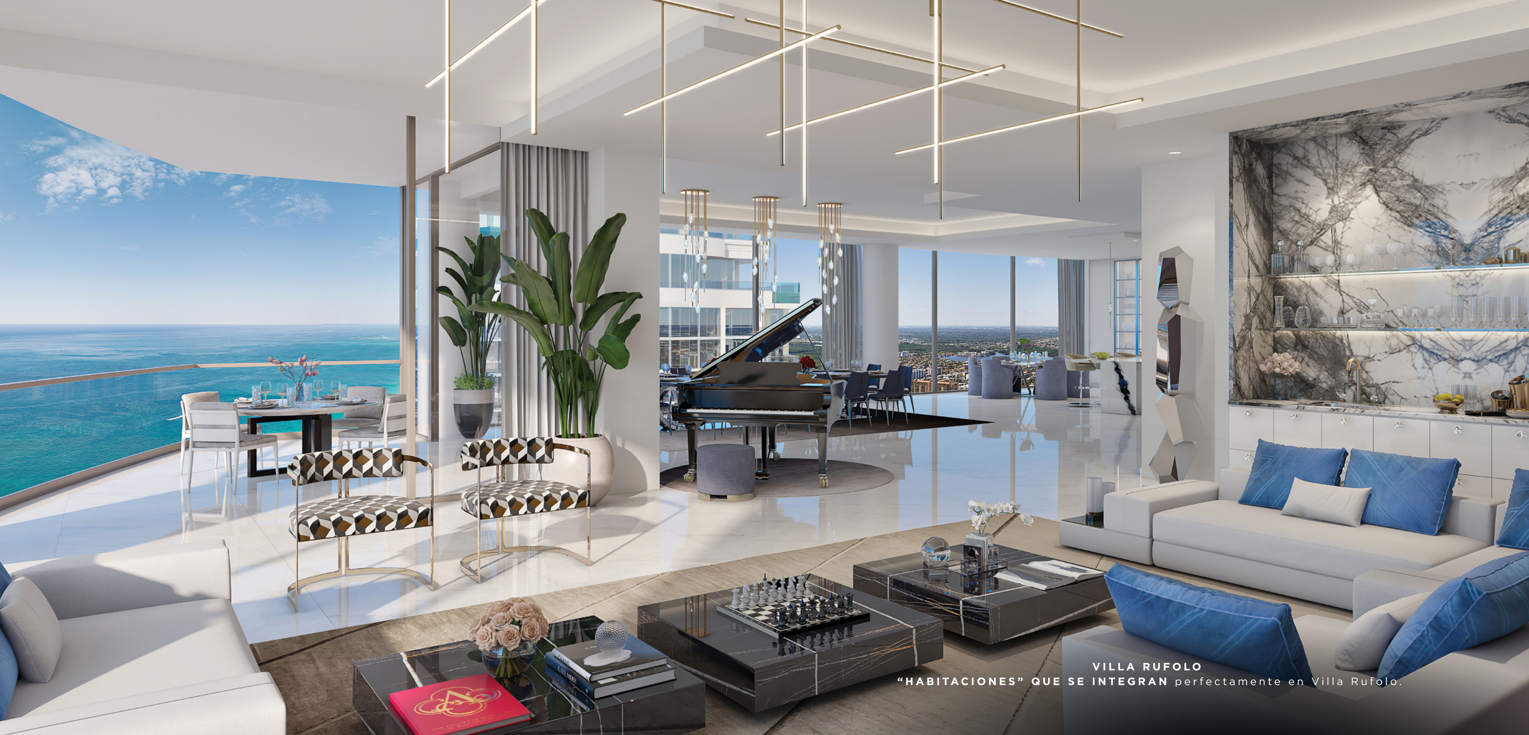
VILLA RUFOLO "HABITACIONES" QUE SE INTEGRAN perfectamente en Villa Rufolo.