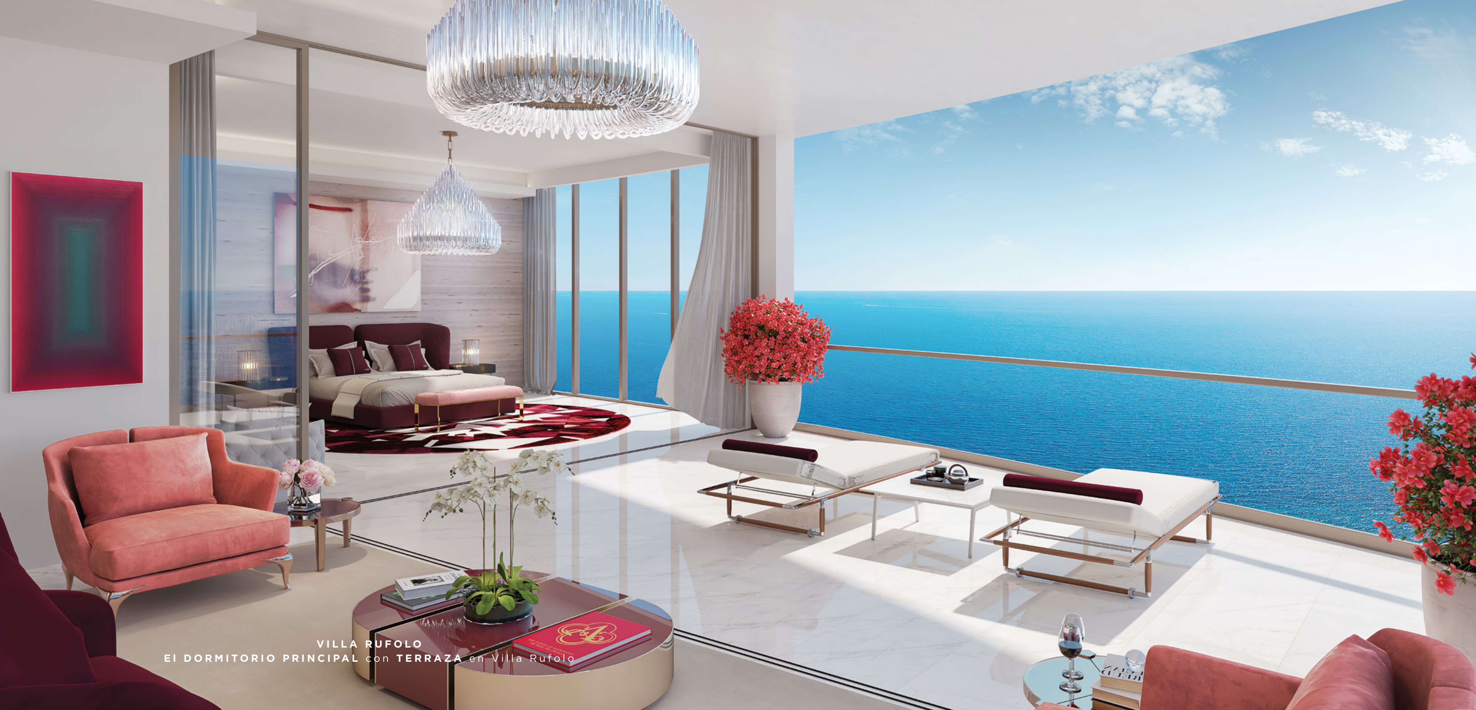
VILLA RUFOLLO EI DORMITORIO PRINCIPAL con TERRAZA en Villa Rufolo