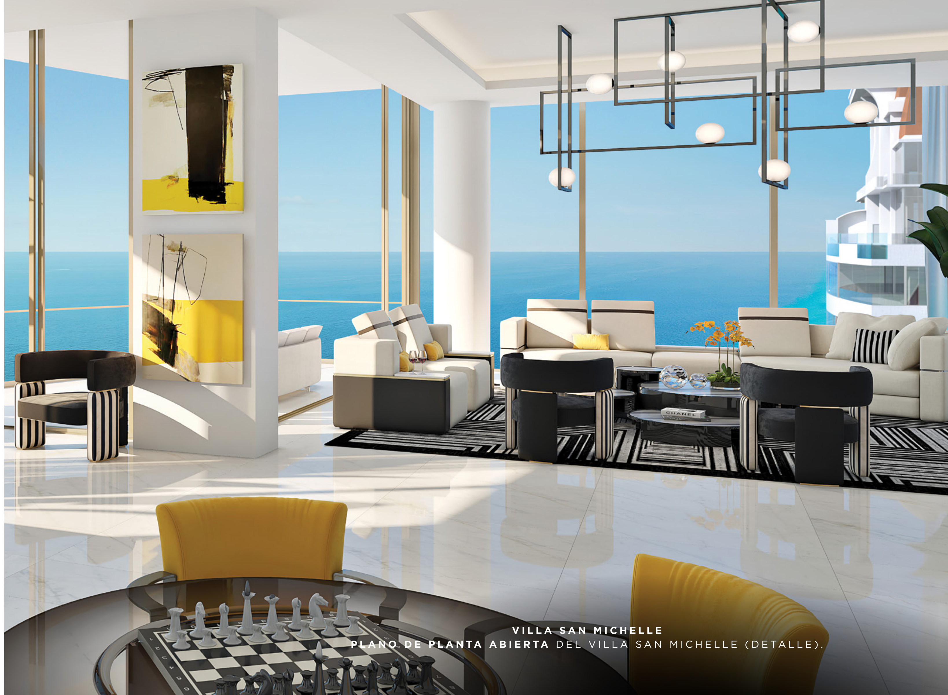
VILLA SAN MICHELLE PLANO DE PLANTA ABIERTA DEL VILLA SAN MICHELLE (DETALLE).

Un piso completo con seis habitaciones, siete baños, dos tocadores, sala amplia, sala familiar, sala de recreación, gimnasio con sauna, cuarto de servicio, oficina opcional y sala de aprendizaje, chimenea, ascensores privados y salas con vistas al atardecer + océano + cocina de verano.