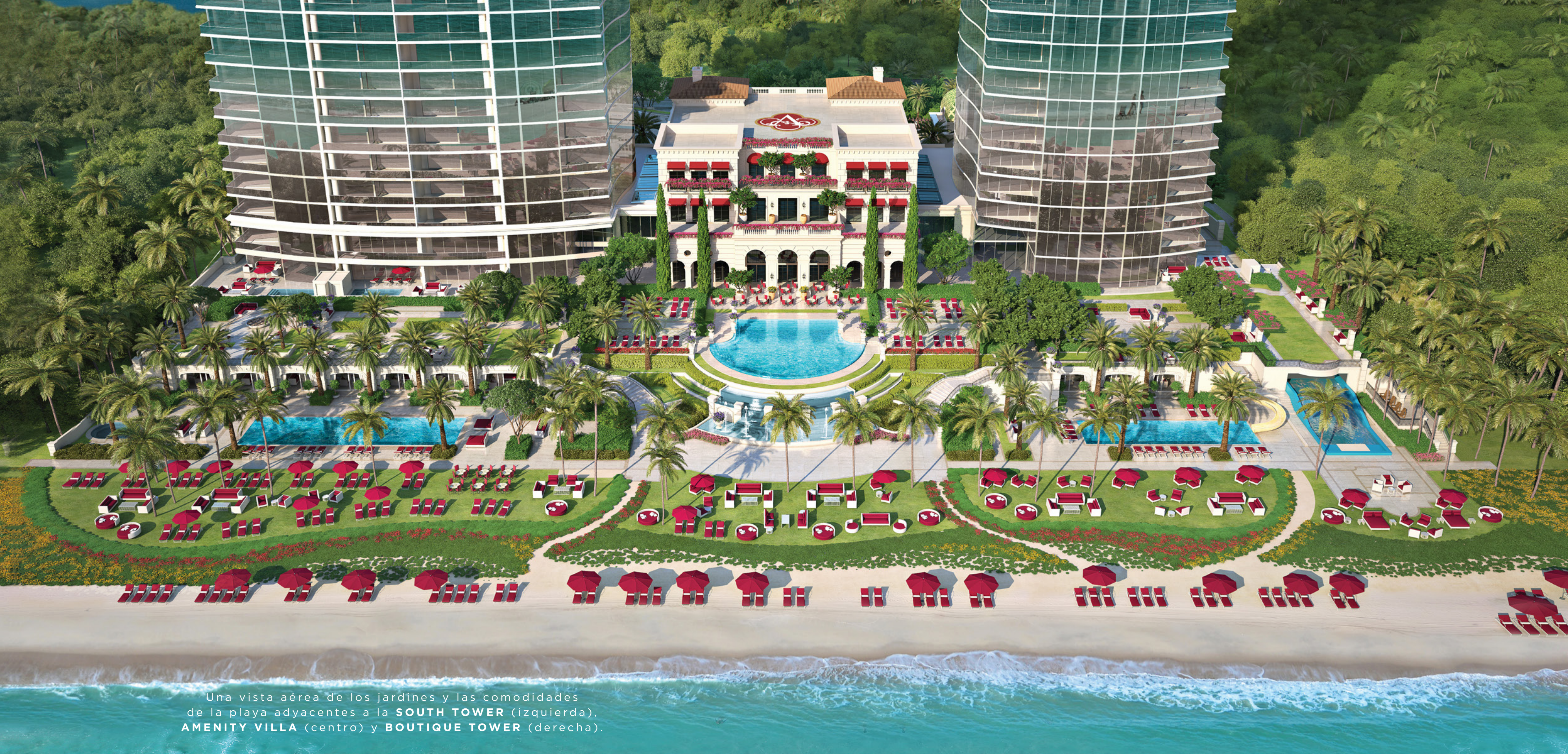
Una vista aérea de los jardines y las comodidades de la playa adyacentes a la SOUTH TOWER (izquierda), AMENITY VILLA (centro) y BOUTIQUE TOWER (derecha).