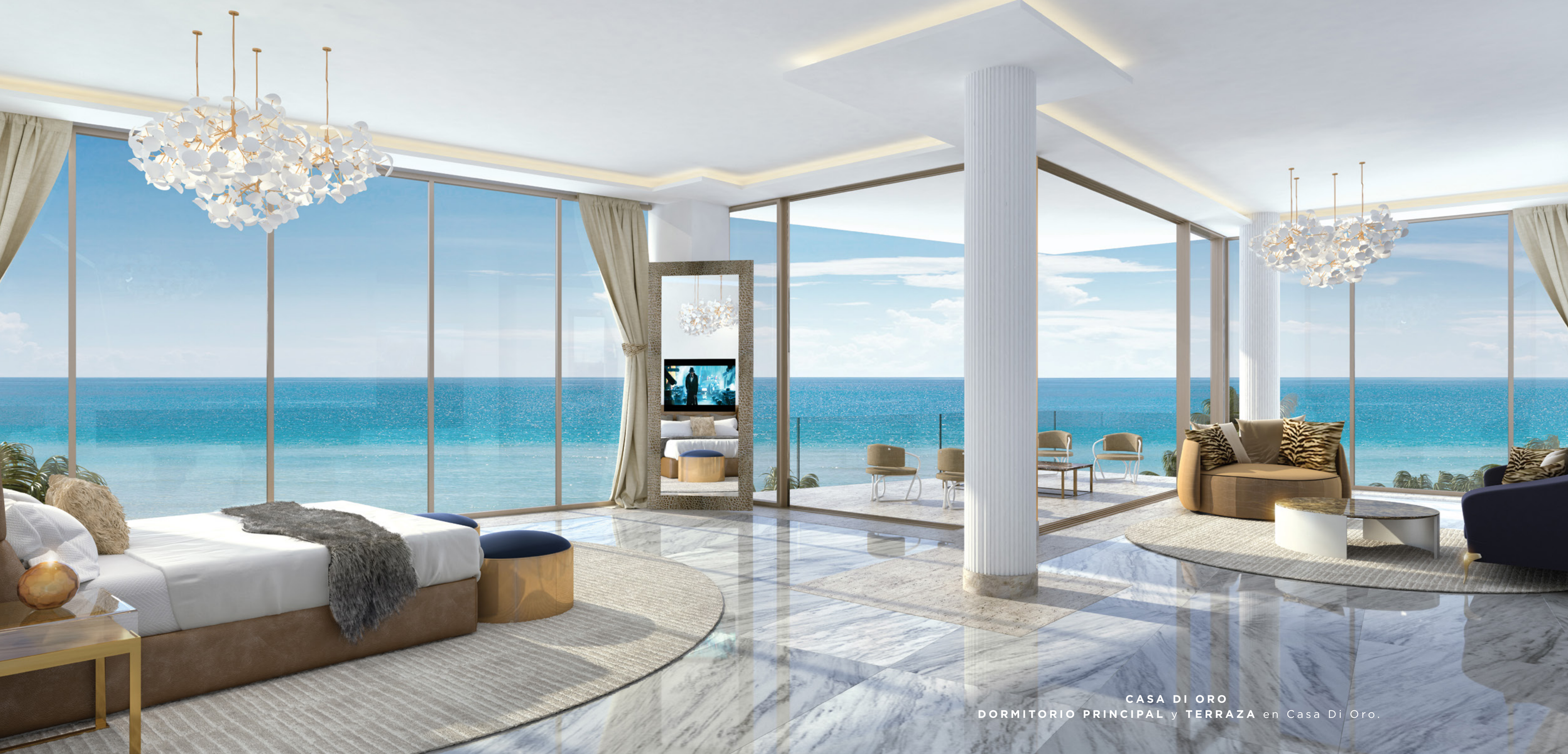
CASA DI ORO DORMITORIO PRINCIPAL y TERRAZA en Casa Di Oro.