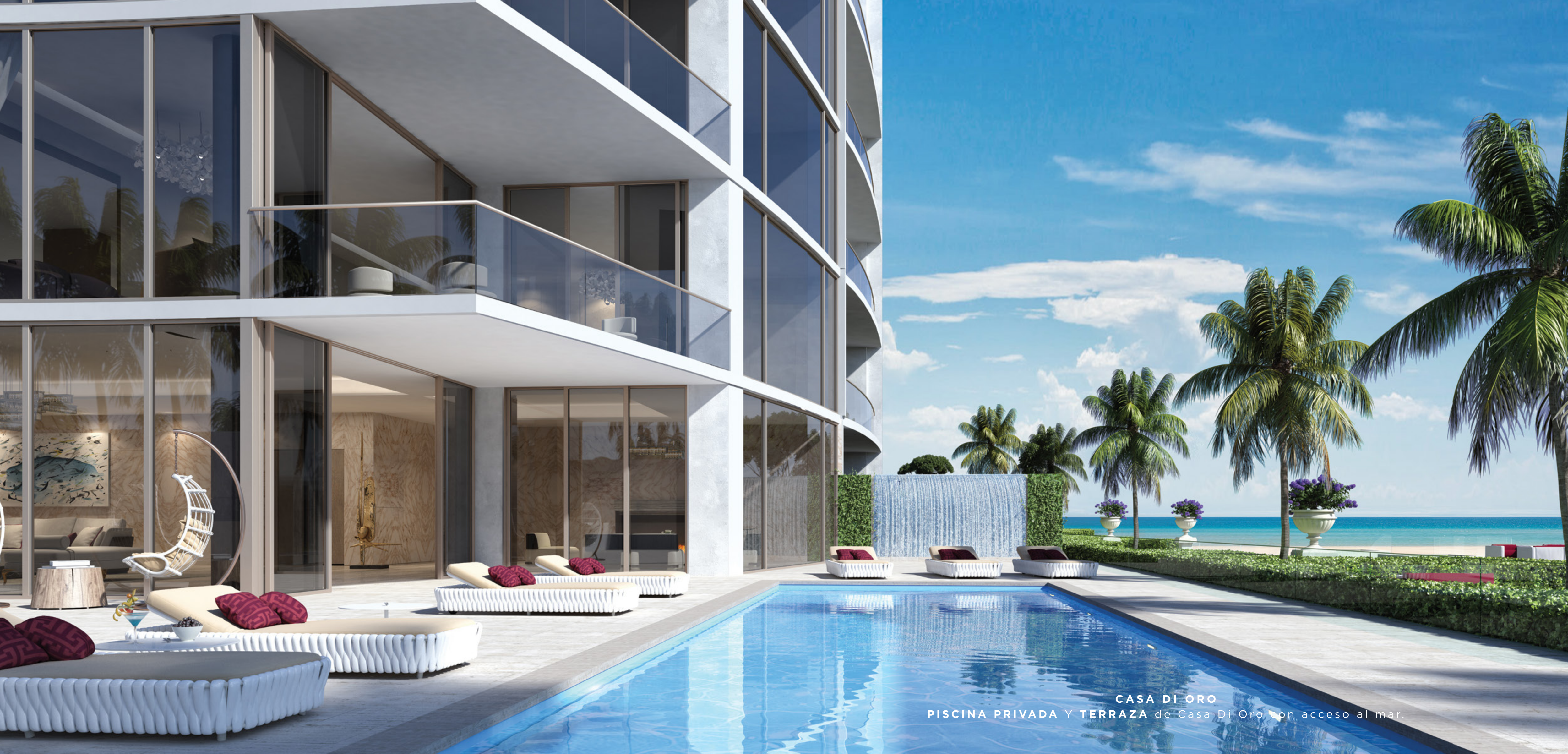
CASA DI ORO PISCINA PRIVADA Y TERRAZA de Casa Di Oro con acceso al mar.