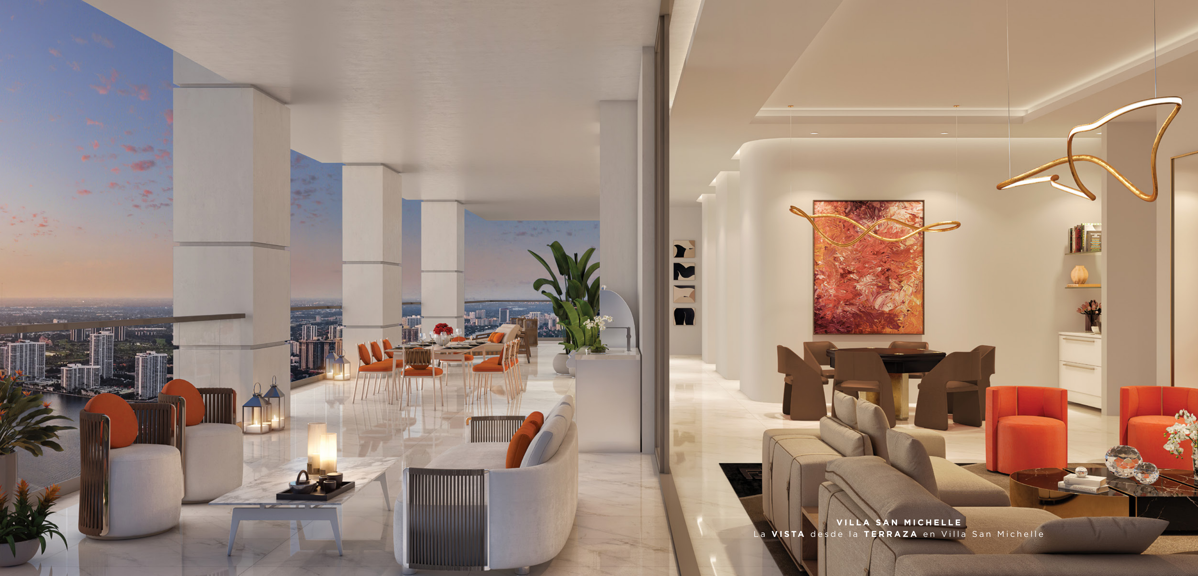
VILLA SAN MICHELLE La VISTA desde la TERRAZA en Villa San Michelle