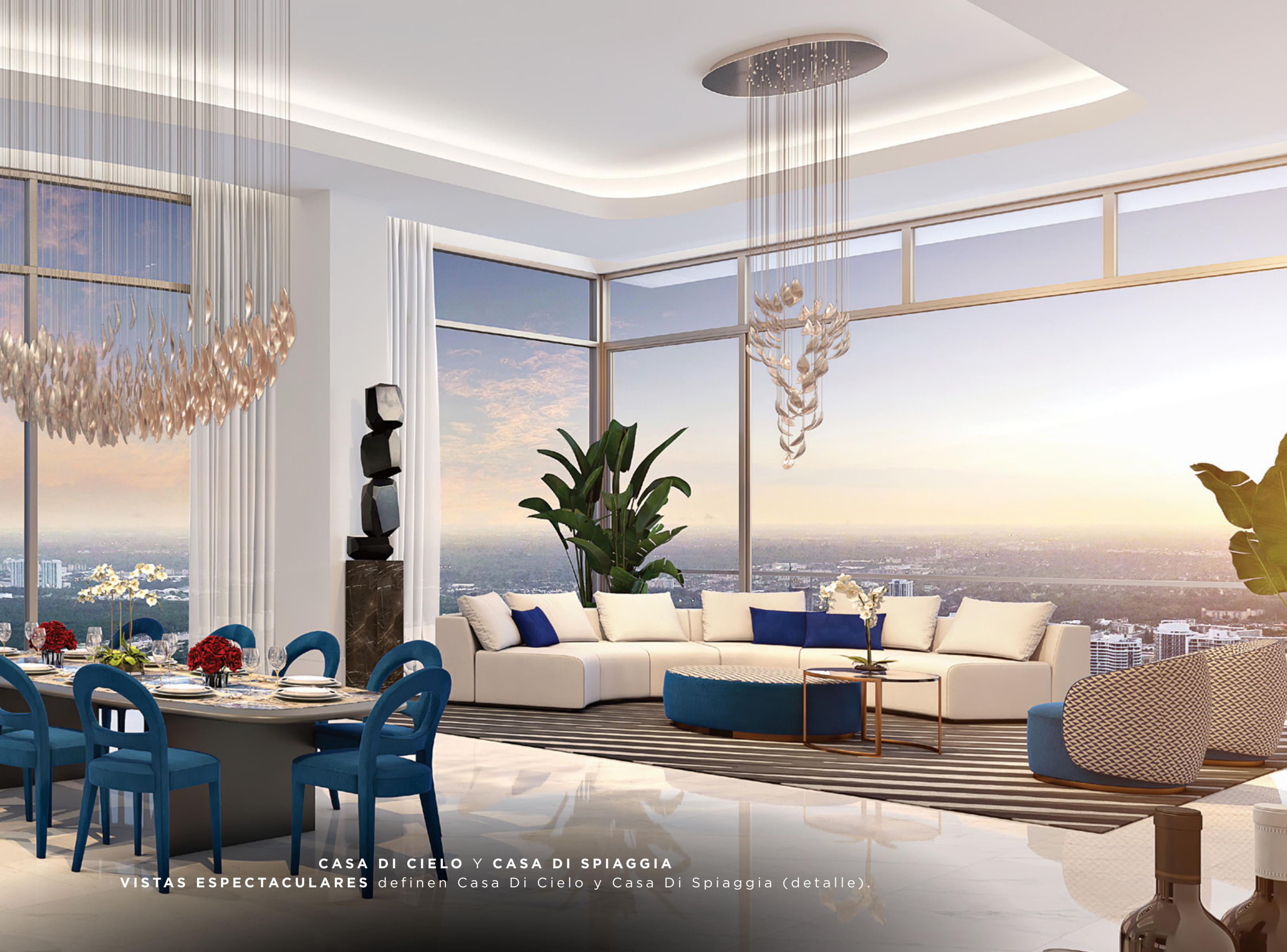
CASA DI CIELO Y CASA DI SPIAGGIA VISTAS ESPECTACULARES definen Casa Di Cielo y Casa Di Spiaggia (detalle).