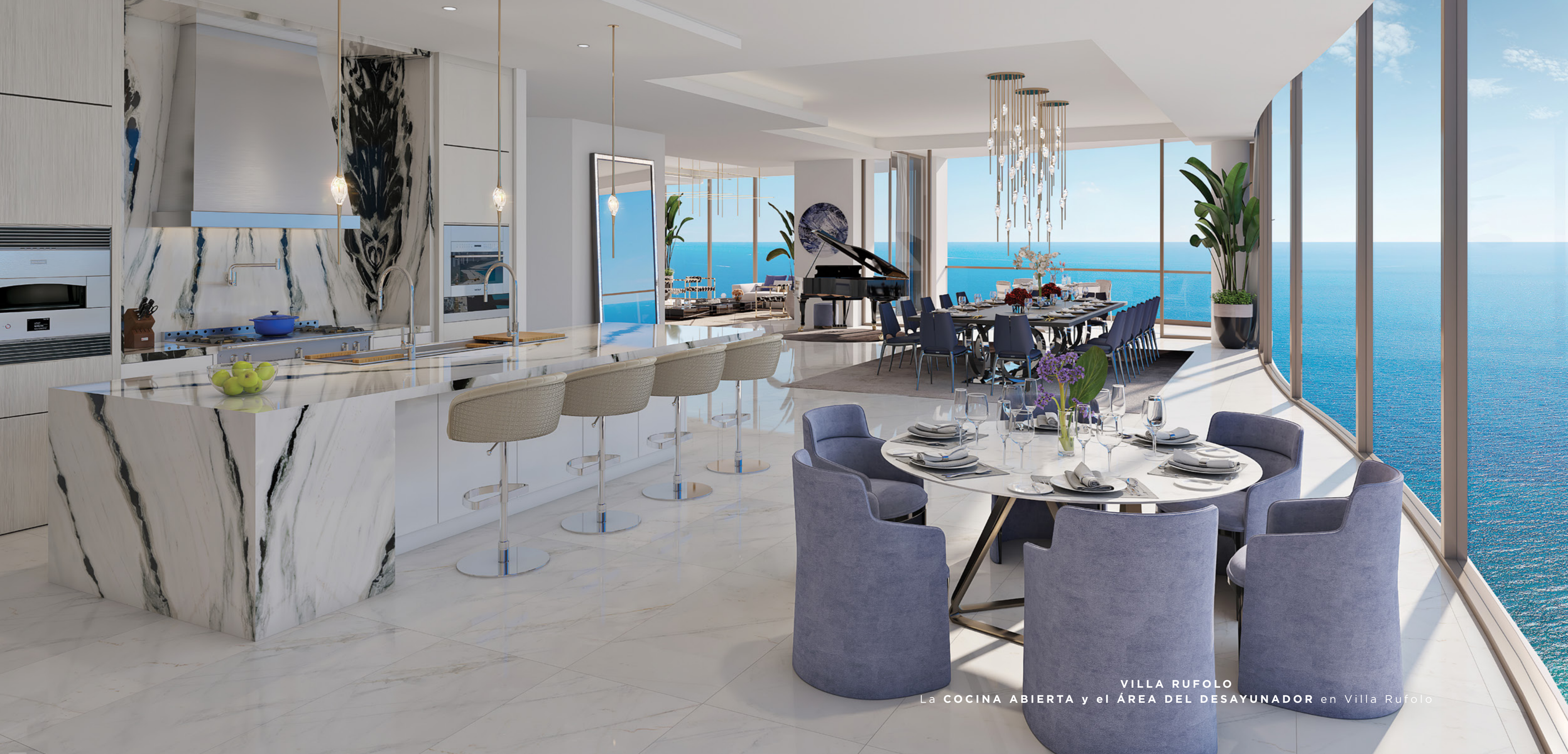
VILLA RUFOLO La COCINA ABIERTA y el ÁREA DEL DESAYUNADOR en Villa Rufolo